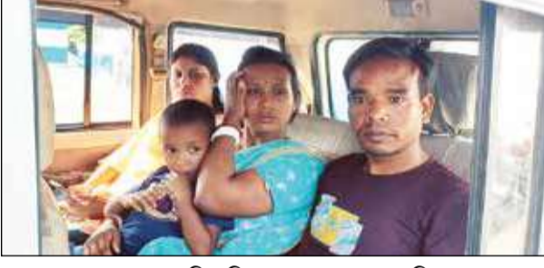
ধৃত বাংলাদেশি পরিবার। মঙ্গলবার ময়নাগুড়িতে।

এই 'ট্যাক্স' দিতে না পারতেই যত সমস্যার সূত্রপাত। মনোরঞ্জন