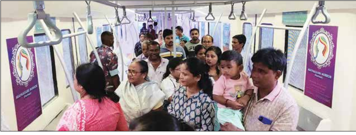
জলের তলায় মেট্রো।।