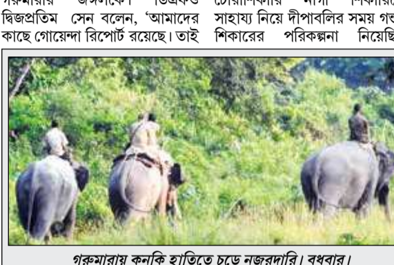
গরুমারায় কুনকি হাতিতে চড়ে নজরদারি। বৃহবার।

লাটাগুড়ি ও নাগরাকাটা, ৩০ অক্টোবর : এর আগেও গরুমারায় জোড়া গন্ডার খুন করে খণ্ডা কেটে নিয়ে যাওয়ার ঘটনা ঘটেছে। ফের চোরশিকারীদের নিশানায় গরুমারায় বন্যকুল। সম্প্রতি অসমে গন্ডার শিকারের পরিকল্পনা করার অপরাধে তিনজনকে গ্রেপ্তার করা হয়। গরুমারাতেও এধরনের ঘটনার আশঙ্কা কথা উল্লেখ করে রাজ্য বন দপ্তরকে সতর্ক করা হয় গোয়েন্দাদের তরফে।