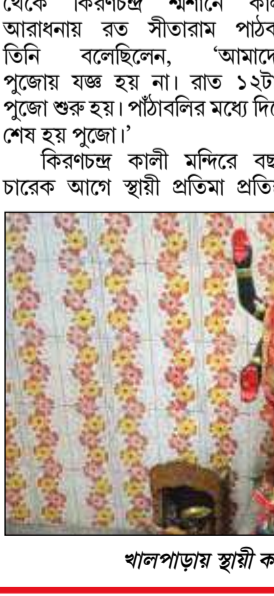
খালপাড়ায় স্থায়ী কালী মন্দিরে মায়ের বিগ্রহ।