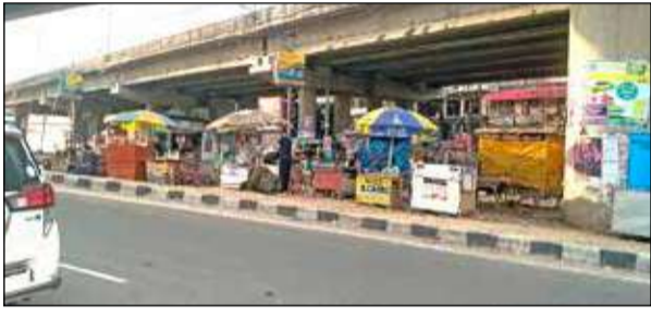
বাগডোগরা উড়ালপুলের নীচে একাধিক দোকানপাট। -সংবাদচিত্র

মহম্মদ হাসিম বাগডোগরা, ৩০ অক্টোবর : বাগডোগরার উড়ালপুলের নীচে দখল করে গড়ে উঠছে একের পর এক দোকান। স্থানীয়দের অভিযোগ, উড়ালপুলের নীচে বিভিন্ন দোকানে রাতের অন্ধকারে চলছে অসামাজিক কাজকর্ম।