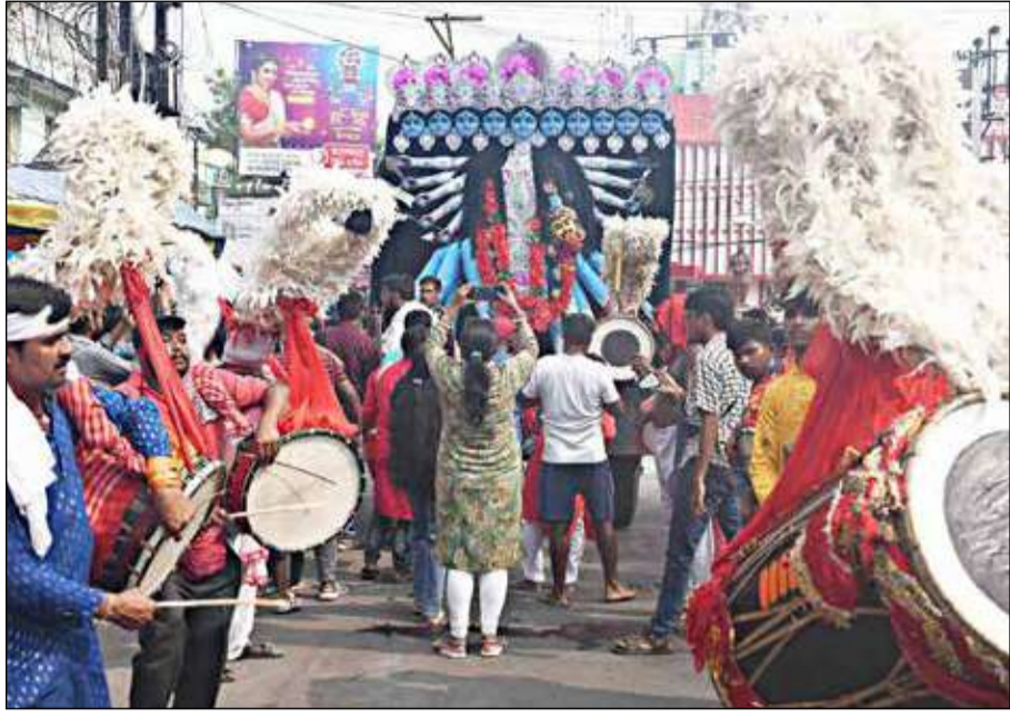
চাকের তালে মণ্ডপের পথে প্রতিমা। বুধবার মালদায়।