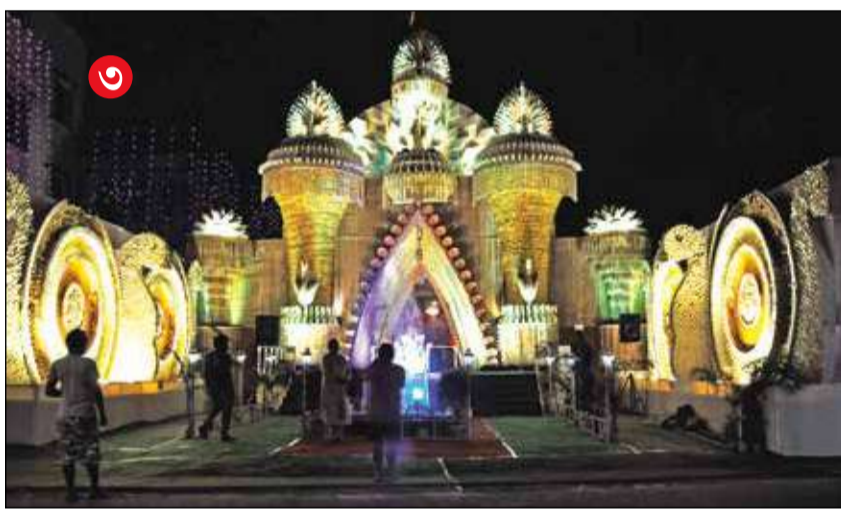
(১) সূর্যনগর ময়দানে আলোর উৎসব। (২) শিলিগুড়িতে কৃষ্ণকালী। (৩) দেশবন্ধুপাড়ার এনটিএস ক্লাবের পূজোমণ্ডপ।