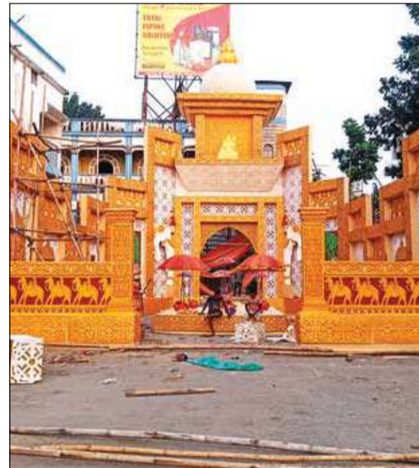
ইসলামপুরের জাগরণী ক্লাবের পূজোমণ্ডপ।