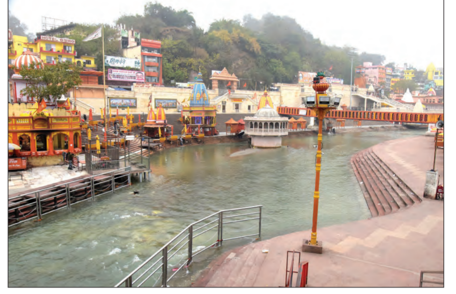
শুক্রবার মকর সংক্রান্তিতে দেশের দুই আলাদা ছবি। উপরে বারাণসী পূর্ণায়ানে পূণ্যার্থীদের ভিড়। নিচে শুনসান হরিদ্বারের হর কি পৌরিঘাটা করোনার জন্য সেখানে বন্ধ করা হয়েছে মকর সংক্রান্তির পূর্ণায়ান।