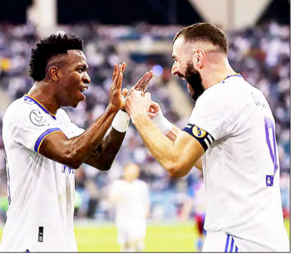
ভিনিস্যাসের সঙ্গে গোলের সেলিব্রেশন করিম বেঞ্জিমা।

সুপার কোপার ফাইনাল রিয়াল জেলা ক্রীড়া সংস্থার অন্তঃকলহ