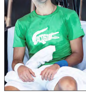
চিন্তার ছাপ নেই জকোর মুখে।

কোভিড সংক্রমণের সময় বিবিভক্ত করেছিলেন সেকথা বুধবার স্বীকার করে নিয়েছেন নোভাক। পাশাপাশি অসতর্কভাবে অস্ট্রেলিয়ায় ট্রাভেল এন্ট্রি ফর্মেও ভুল তথ্য দেওয়ার কথা মেনে নিয়েছেন তিনি। এরপরেই নড়েচড়ে বসেছে অস্ট্রেলিয়ার ফেডারেশন সরকার। তথ্যগোপনের অভিযোগ উঠতে শুরু করেছে সার্ব