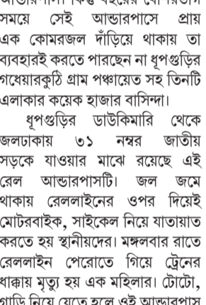
জলমগ্ন টুকনিমারি আন্ডারপাস - সংবাদচিত্র