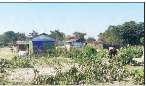
শিলিগুড়ি সংলগ্ন পোড়াঝাড়ে দখল হয়ে যাওয়া জমি।