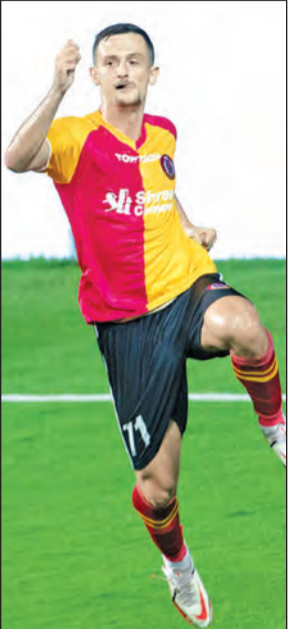
এসিসি ইস্টবেঙ্গলের রক্ষণে ভরসা জোগান্ডে ফ্রান্সে পার্চে।

নিজস্ব প্রতিনিধি, কলকাতা, ২৪ নভেম্বর : এর আগে সাইপ্রাসের ক্লাবে খেলার সময় প্রথম ম্যাচে মাঠে নেমেই তাঁর গোল ছিল। সেবার জিতেছিলেন। তাই আশা ছিল,