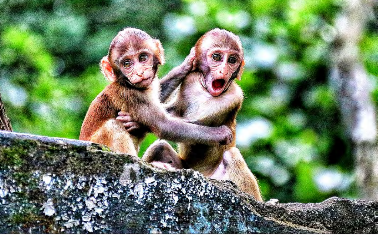
বাঁদরামি। খুনশুটিতে মেতে দুই বাঁদর শাবক। জলদাপাড়ায় অপর্ণা গুহরায়ের তোলা ছবি।