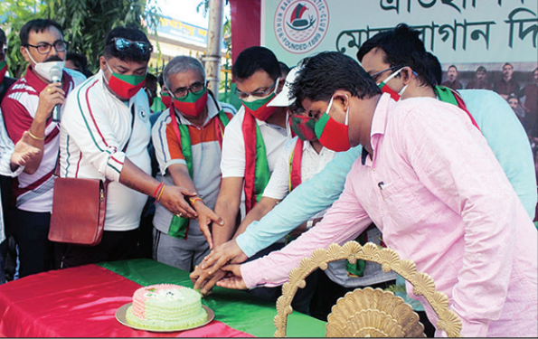
কেক কাটা হচ্ছে শিলিগুড়িতে।

দিনে শিলিগুড়ি মেরিনার্সের তরফে মোহনবাগানকে নিয়ে আন্তঃবিদ্যালয় রক্তবাবুর মাধ্যমে বাধা যতীন পার্কে