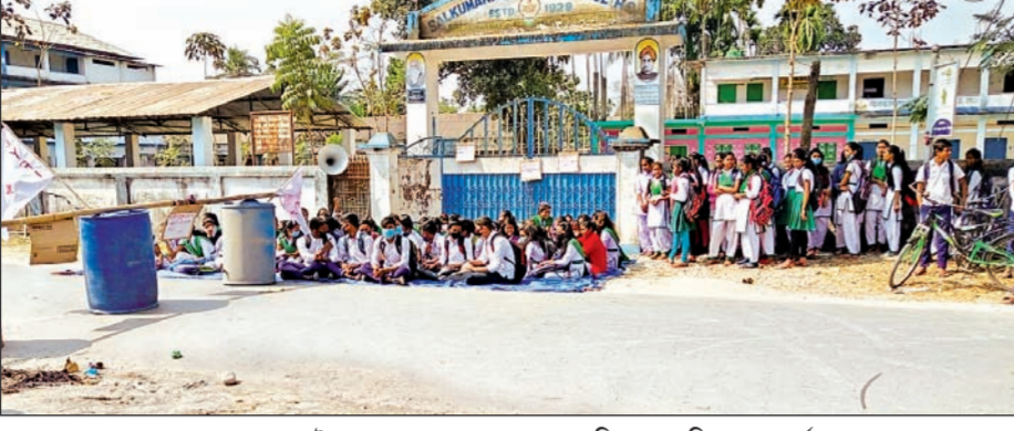
শালকুমারহাটে স্কুল পড়ুয়ারের পথ অবরোধ ও বিক্ষোভ

শালকুমারহাট, ২২ ফেব্রুয়ারি : সম্প্রতি নবম থেকে দ্বাদশ শ্রেণি পর্যন্ত স্কুল খুলেছে। এর মধ্যেই একজন শিক্ষক ও একজন শিক্ষিকার বদলি হওয়ায় সোমবার আলিপুরদুয়ার-১ ব্লকের শালকুমারহাটে রাজ্য সড়ক অবরোধ করে বিক্ষোভে শামিল হয় পড়ুয়ারা। শিক্ষকদের বদলি রুখতে ছাত্রছাত্রীদের এই অবরোধে নেতৃত্ব দেয় ডিওয়াইএফআই ও এসএফআই। সূত্রের খবর, এমনিতেই বহু বছর ধরে শিক্ষক নিয়োগ বন্ধ রয়েছে। তার ওপর বহু শূন্যপদ থাকায় পঠনপাঠনে সমস্যা হচ্ছে। তাই এদিন পথে নামে পড়ুয়ারা। বরপেয়ে অবরোধস্থলে পৌঁছিয়ে সোনাপুর ফাঁড়ির পুলিশ। পরে ওসি পিটি ভূট্টায়ার আশ্বাসে অবরোধ তুলে নেয় পড়ুয়ারা।