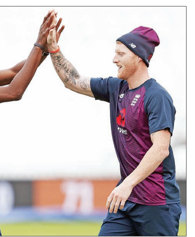
অনুশীলনে চললেন স্টিভেন স্মিথ (বামে)। সিরিজ হারের আশঙ্কার মানেও ফুরফুরে মেজাজে বেন স্টোকস ও জোজা আর্চার।

১৯৬০-এর অ্যাসেসে ব্র্যাডম্যানের ৯৭৪ রান থেকে অনেক দূরে হলেও, স্মিথের মধ্যে তদের ছায়া দেখছেন অনেকেই।