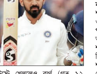
ওপেনিং নিয়ে 'চ্যাম্পিয়নদের' চুক্তি

সম্ভবত সেই সুযোগ পাচ্ছেন হিটম্যান। ওপেনিং নিয়ে 'চ্যাম্পিয়নদের' চুক্তি চুক্তি করেছেন প্রসাদরা।