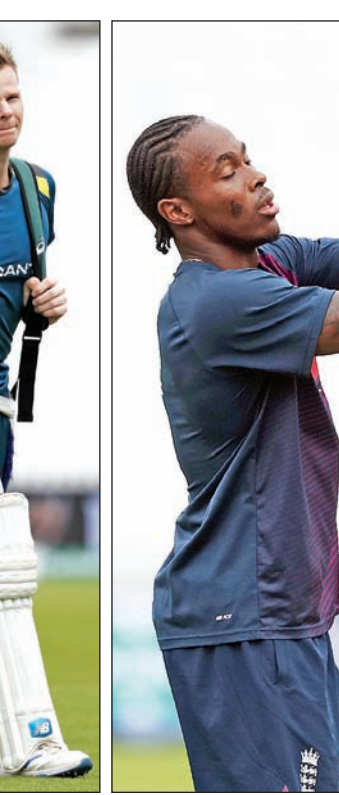
অনুশীলনে চললেন স্টিভেন স্মিথ (বামে)। সিরিজ হারের আশঙ্কার মানেও ফুরফুরে মেজাজে বেন স্টোকস ও জোজা আর্চার।

মুখড়ে থাকা রুটদের অবশ্য অনুপ্রেরণা জোগাবে কোচ ট্রেভর বেইলিসের ফেরারওয়েল আবেগ।