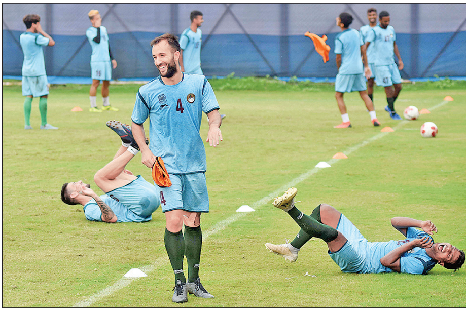
ফুরফুরে হওয়া মোহনবাগানের অনুশীলনে।