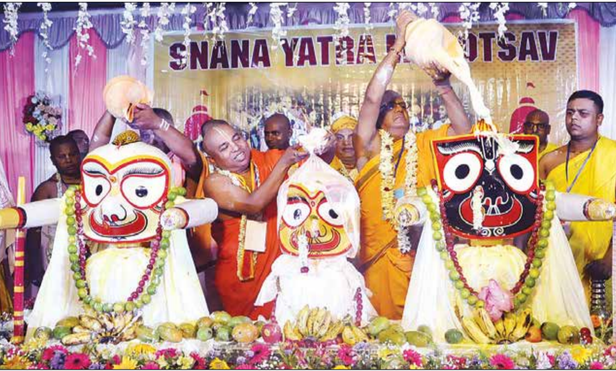
জগন্নাথ, বলরাম ও সুভদ্রার মহা অভিষেক। শিলিগুড়ির ইসকনে। সোমবার।

শিলিগুড়ি, ২৯ জুন : মাসির বাড়ির আদর পেতে আর বাকি মাঠে ১৫ দিন। তার আগে এখন বিশ্বামের পালা। ১০৮ কলসির জলে মনের আনন্দে মনের পর জ্বরজারির হাত থেকে আর রক্ষা করবে কে? রথযাত্রার আগে তাই এই দুই সপ্তাহ নানা পথিকেকে সঙ্গী করে তিন ভাই-বোনের চাঙ্গা হয়ে ওঠার পালা। সকাল থেকেই মন্দিরে থিকথিকে ভিড় ভক্তদের। সোমবার ধুমধাম করে শিলিগুড়ি ইসকনেও পালিত হল জগন্নাথ দেবের স্নানযাত্রা। পবিত্র এই দিনটি উপলক্ষে সকাল থেকেই মন্দিরে পূজার আয়োজনের প্রস্তুতি চলে। বিকেলে ১০৮ কলসির জলে জগন্নাথ, বলরাম ও সুভদ্রার মহা অভিষেক করা হয়। মন্দিরের অডিটোরিয়ামে এই মহা স্নানযাত্রার বন্দোবস্ত করা হয়।