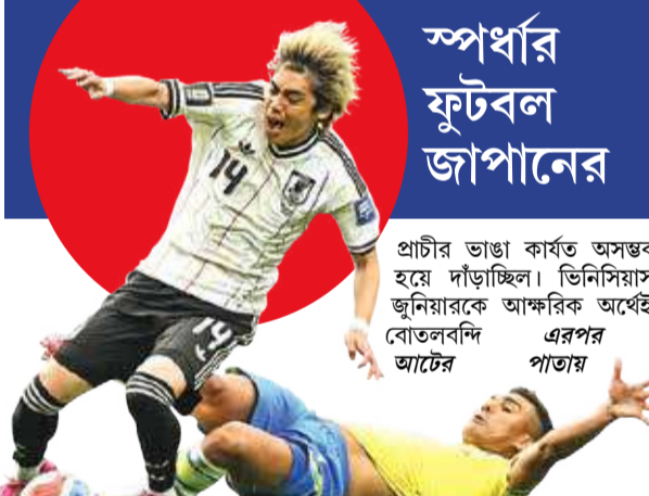
স্পর্ধার ফুটবল জাপানের প্রাচীর ভাঙা কার্যত অসম্ভব হয়ে দাঁড়িয়েছিল। তিনিসিয়াস জুনিয়রকে আক্ষরিক অর্থেই বোতলবন্দি এরপর পাতায়

জমায়েত। প্রেস বক্সে বসে চারপাশের এই তীর স্নায়ুর চাপ আমি অক্ষরে অক্ষরে টের পাচ্ছিলাম। ধারে-ডারে ও সমর্থনে যোজন যোজন এগিয়ে থাকা ব্রাজিলকে প্রথমার্ধের একটা বড় সময় রীতিমতো ঘাম ছুটিয়ে দিয়েছিল জাপান। রেফারির বাঁশি বাজার পর থেকেই মাঠের দখল নিয়ন্ত্রণে কালো আসলোত্তির দল। প্রথমার্ধের শুরুতে ৬৩ শতাংশ বলের দখল তাদের পায়ে থাকলেও, জাপানের ৫-৪-১ ছকের নিশ্চিন্দ