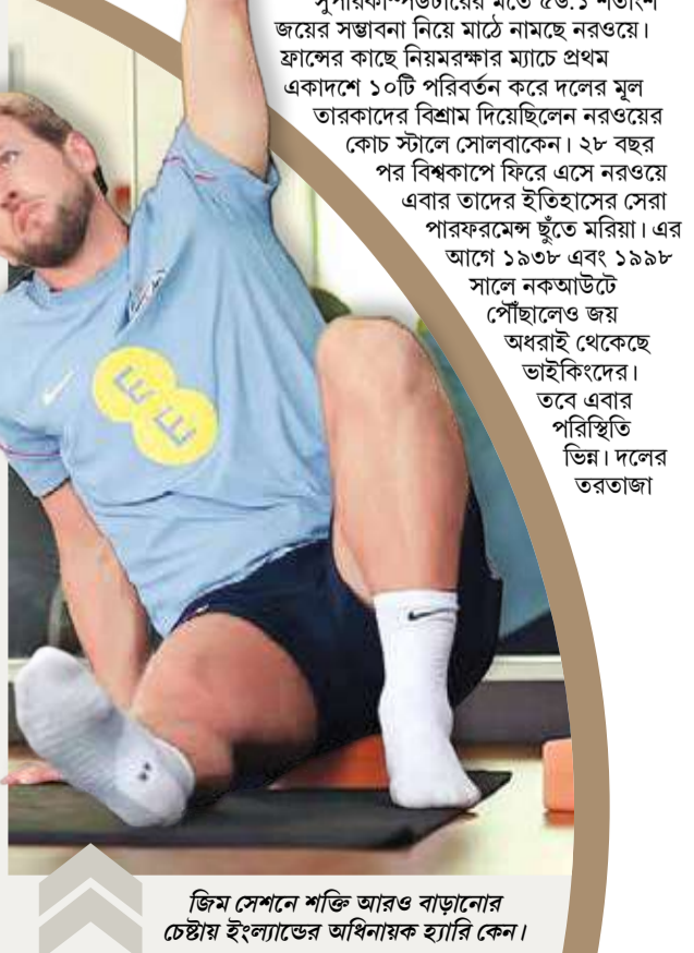
জিম সেশনে শক্তি আরও বাড়ানোর চেষ্টায় ইল্যান্ডের অধিনায়ক হ্যারি কেন।

আটলান্টা, ২৯ জুন : আগামী বুধবার বিশ্বকাপের শেষ বত্রিশের ম্যাচে ডিআর কঙ্গোর বিরুদ্ধে মাঠে নামতে চলেছে ইল্যান্ড। এই গুরুত্বপূর্ণ নকআউট ম্যাচের আগে প্রথম একাদশে অন্তত তিনটি বড়সড়ো পরিবর্তনের কথা গুরুত্ব দিয়ে ভাবছেন থ্রি লায়ন্স কোচ টমাস টুচেল। গত শনিবার পানামার বিরুদ্ধে ২-০ গোলে জয়ের ম্যাচে গোড়ািলতে চোট পেয়েছিলেন জ্যারেল কুয়ানসা। তাঁর চোট খুব একটা গুরুতর না হলেও বুধবার রাইট ব্যাকে তাঁর বদলে জেড