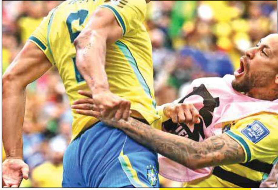
সমতা ফেরানোর আনন্দে নেইমার জুনিয়রের সঙ্গে উল্লাসে মাতলেন ক্যাসেমিরো।

শিলিগুড়ি ১৫ আষাঢ় ১৪৩৩ মঙ্গলবার ৫.০০ টাকা 30 June 2026 Tuesday 12 Pages Rs. 5.00 ইন্টারনেট সংস্করণ www.uttarbongsambad.in Vol No. 47 Issue No. 43