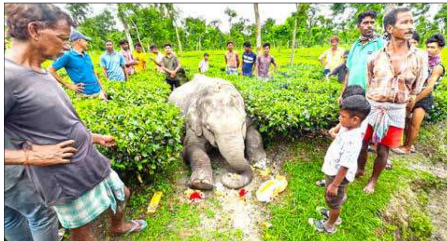
পড়ে আছে হাতির নিখর দেহ। নাগরাকাটার ছাড়াটতুর বস্তির মেচপাড়ায়।

নাগরাকাটা, ২৯ জুন : উত্তরবঙ্গের ডুয়ার্সজুড়ে হাতির মৃত্যুর মিছিল যেন থামার নয়। এবার নাগরাকাটা রকের অন্তর্গত ছাড়াটতুর মেচপাড়া এলাকার একটি ছোট চা বাগান থেকে উদ্ধার হল এক হাতির নিখর দেহ। বন দপ্তর সূত্রে খবর, মৃত হাতির বয়স আনুমানিক ৫ বছর। সোমবার সন্ধ্যা পর্যন্ত লিঙ্গ নিয়ে স্পষ্ট কোনও তথ্য না মিললেও, প্রাথমিক পরীক্ষা শেষে বনকর্তাদের ধারণা মৃত বুনাটি মাদি হাতি। প্রাথমিকভাবে বজ্রপাতের ফলেই হাতির মৃত্যু হয়েছে বলে অনুমান করা হচ্ছে। তবে মৃত্যুর প্রকৃত কারণ মন্যাতদন্তের রিপোর্ট আসার পরই নিশ্চিত হওয়া যাবে বলে জানানো হয়েছে।