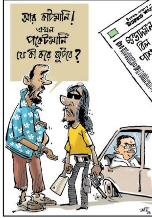
চড়া সুরে। উত্তেজিত মেজাজে মানুষের সম্পত্তি নষ্ট করলে শুধু তিনি জানান, সরকারি বা সাধারণ জেল খেতে পার পাওয়া যাবে না।

আইনটির অপব্যবহার হবে না ও ভদ্রলোকদের জন্য এই আইন নয় বলে আশ্বাস দিলেও বিধানসভায় সোমবার মুখ্যমন্ত্রীর ভাষণ ছিল