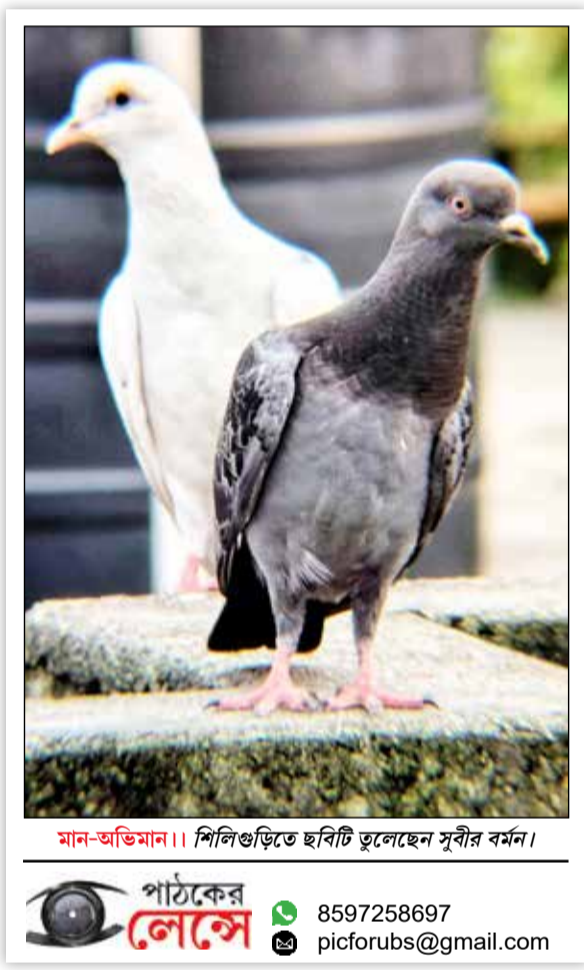
মান-অভিমান। শিলিগুড়িতে ছবিটি তুলেছেন সুবীর বর্মন।

দখল, বিরোধীদের হুমকি দেওয়ার অভিযোগ রয়েছে হামিদুল-ঘনিষ্ঠ ওই তৃণমূল নেতার বিরুদ্ধে।