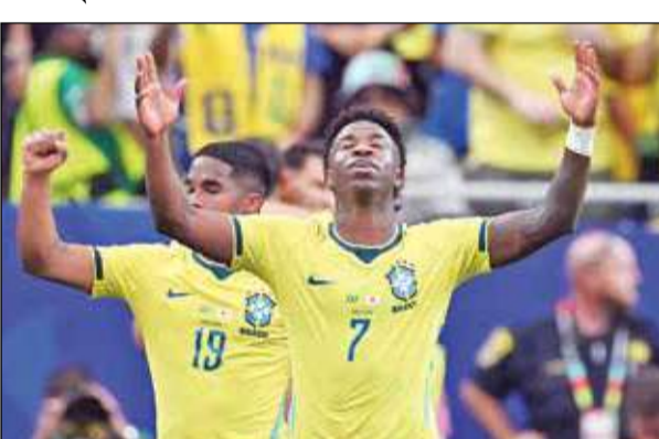
২০০২ সালের পর প্রথমবার বিশ্বকাপে পিছিয়ে পড়েও জয় পেলে ব্রাজিল। ব্যক্তিগত ভিনিসিয়াস জুনিয়ার ও এনট্রিক। সোমবার হিউস্টনে।

জাপানের বিরুদ্ধে বিশ্বকাপের মঞ্চে নকআউটে যাত্রা শুরু করলেও ভিনি বাত, ফুটবলার হিসেবে মাঠের সাফল্যের চেয়েও সমাজের প্রতি তাঁর দায়বদ্ধতা অনেক বেশি গুরুত্বপূর্ণ। ইউরোপে বারবার বর্ণবাদের বিরুদ্ধে আক্রমণের