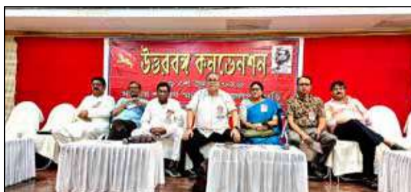
জলপাইগুড়িতে সমাবয় শতবর্ষ ভবনে ফরওয়ার্ড ব্লকের উত্তরবঙ্গ কনভেনশন।

জলপাইগুড়ি, ২৯ জুন : উত্তরবঙ্গের উন্নয়ন মানে শুধুই শিলিগুড়ি কেন্দ্রিক, এমনটা সমীচীন নয় বলে মনে করে ফরওয়ার্ড ব্লক।