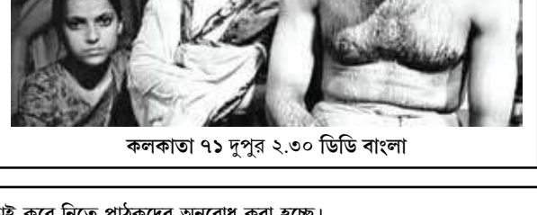
কলকাতা ৭১ দুপুর ২.৩০ ডিডি বাংলা

লাপতা লেডিজ সন্ধ্যে ৭.৫০ সোনি ম্যান্ন টু বিকেল ৪.৪৮ মেজর, সন্ধ্যে ৭.৫০ লাপতা লেডিজ, রাত ১০.২৮ ইন্ডেলিগেন্স