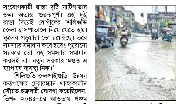
বেহাল রাস্তায় তৈরি হয়েছে গর্ত। সোমবার মাটিগাড়ায়।