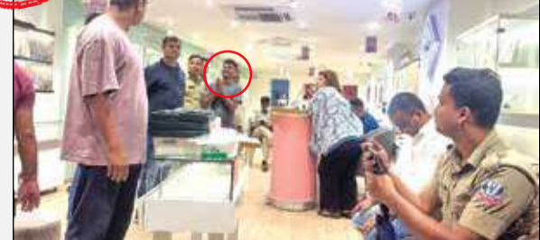
পুলিশ ও শোরুম কর্তৃপক্ষের কাছে ক্ষমা চাইছে ধৃত দুষ্কৃতী।

রাস্তার দিকে দৌড়াতে থাকে। পরিস্থিতি বুঝে পুলিশও দুটি দলে ভাগ হয়ে দুষ্কৃতীদের পিছু নেয়। বেশ কিছুক্ষণ ধরে তাড়া করার পর অবশেষে জ্যোতিনগরের রাস্তা থেকে এক দুষ্কৃতীকে পাকড়াও করতে সক্ষম হয় পুলিশ। তার কাছ থেকে উদ্ধার হওয়া ব্যাগের ভেতর থেকে বেশ কিছু সোনা মিলেছে। অন্যদিকে, দোকানের ভেতরেও তল্লাশি চালাতে দোকে পুলিশের আরেকটি দল। সেখানে ঢুকতেই তারা অবাক হয়ে যান। দেখা যায়, দলের আরও এক সদস্য 'অপারেশন' চালিয়ে যাচ্ছে। বমাল তাকেও গ্রেপ্তার করে পুলিশ।