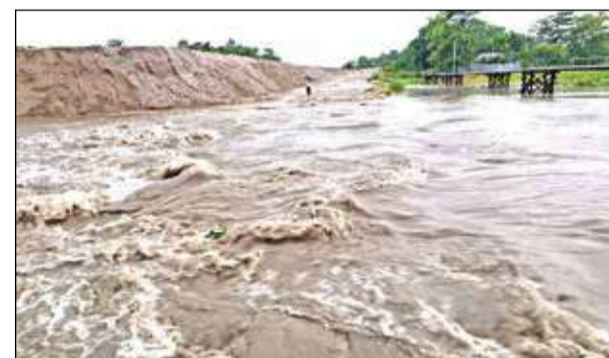
চরতোষায় ডাইভারশনের উপর দিয়ে বইছে জল। সোমবার।

ফালাকাটা, ২৯ জুন : রবিবার ছুটির দিন থাকায় রক্ষা মিলেছিল। কিন্তু রাতের ভারী বর্ষণে সোমবার যুম থেকে উঠতেই কার্ভ নরকযন্ত্রণা প্রত্যক্ষ করলেন ফালাকাটাবাসী। ফের জলের তলায় ফালাকাটা-সলসলাবাড়ি মহাসড়কের চরতোষায় ডাইভারশন। শুধু জলমগ্ন হওয়াই নয়, ডাইভারশনের পশ্চিম দিকের সংযোগকারী রাস্তা ভেঙে দু'টুকরো হয়ে যাওয়ায় সম্পূর্ণ বিচ্ছিন্ন হয়ে পড়েছে যোগাযোগ ব্যবস্থা। ফলে এদিন সকাল থেকে চরম বিপাকে পড়েছেন স্থান-কলেজের পড়ায়, শিক্ষক থেকে শুরু করে সাধারণ চাকরিজীবীরা। সড়ক কর্তৃপক্ষের চরম উদাসীনতায় বছরের পর বছর কেন চরতোষায় নদীতে তৎপরতার সঙ্গে অন্তত একটা পাকা সেতু তৈরি করা গেল না তা নিয়ে এখন ক্ষোভে ফুঁসেছে গোটা এলাকা। এদিন সকাল থেকেই দোলং ডাইভারশনের ওপর দিয়েও জল বহতে শুরু করে। সোনাপুড়ের কাছে সাহেবপোতা আরও একটি ডাইভারশন ভেঙে যায়। ফলে