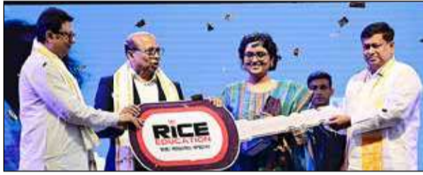
রাইস এডুকেশন, সংস্থার সফল ছাত্রছাত্রীদের সংবর্ধনা দেওয়ার জন্য ১৬তম সমাবর্তন উৎসবের আয়োজন করে।

২৯ জুন : রবিবার কলকাতার বিশ্ব বাংলা এগজিভিশন সেন্টারে রাইস এডুকেশন, সংস্থার সফল ছাত্রছাত্রীদের সংবর্ধনা দেওয়ার জন্য ১৬তম সমাবর্তন উৎসবের আয়োজন করে।