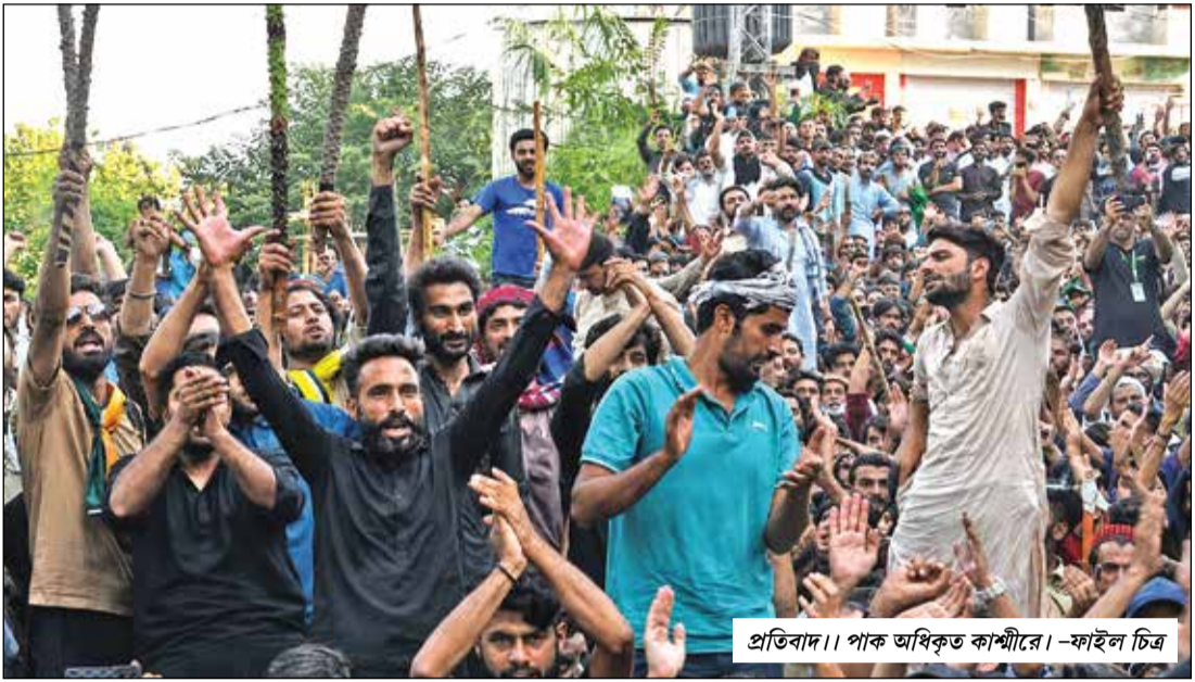
প্রতিবাদ। পাক অধিকৃত কাশ্মীরে - ফাইল চিত্র

বিদ্যুতের লাগামহীন দাম, নিতান্তরাজনৈতিক আটোর তীর সংকট- এক মিলিয়ে বর্তমানে এক যৌর অন্ধকারের মধ্যে ডুবে আছে পাক অধিকৃত কাশ্মীর বা পিওকে।