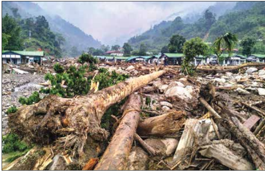
প্রকৃতির মার... বন্যাবিধ্বস্ত অরুণাচল, ধ্বংসাবশেষের খণ্ডচিত্র। সোমবার।

প্রতিফলিত করে। তবে প্রধানমন্ত্রীর পূর্বনির্দেশে বিদেশ সফরের কারণে তিনি নিজে না গিয়ে উচ্চপায়ে প্রতিনিধি দল পাঠানোর সিদ্ধান্ত নেওয়া হয়েছে। ইরানি কর্তৃপক্ষ জানিয়েছেন, ৪ ও ৫ জুলাই তেহরানের গ্র্যান্ড মোসল্লা কমপ্লেক্সে সাধারণ মানুষের শ্রদ্ধাঞ্জলিপনের জন্য প্রয়াত নেতার মরদেহ রাখা হবে। এরপর ৬ জুলাই তেহরানে রাষ্ট্রীয় কোমিশনিয়ে অনুষ্ঠিত হবে। সেই উপলক্ষে তেহরান সরকারি ছুটি ঘোষণা করা হয়েছে। ৭ জুলাই কোম শহরে বিশেষ ধর্মীয় আচারের পর ৯ জুলাই খামেনেই-এর জন্মস্থান মশাহাদে তার দেহ কবরস্থ করার মাধ্যমে রাষ্ট্রীয় আনুষ্ঠানিকতা শেষ হবে। ২৮ ফেব্রুয়ারি তেহরানে ইজরায়েল ও আমেরিকার যৌথ হামলায় খামেনেইয়ের মৃত্যু হয়।