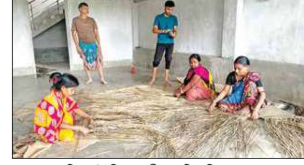
কোচবিহারে তৈরি হচ্ছে শীতলপাটি।

কোচবিহার, ২৯ জুন : তপু গ্রীষ্মের ভরদুপুরে তপু শরীরটাকে এলিয়ে দিতে বিছানা কিংবা মেঝেতে পেতে রাখা শীতলপাটির চেয়ে আরামদায়ক আর কী-ই বা হতে পারে! এই পাটিতে শুয়ে তৃপ্তির যে ঘুমটা আসে, সেই অপার্থিব স্বাদ যিনি একবার নিয়েছেন একমাত্র তিনিই তা জানেন। আর এই পরম আরামের নেপথ্যে রয়েছে যে দক্ষ হাতগুলি, সেই বেত গাছের ছাল কেটে পাটি বোনা মানুষদের ঘরে এখন উৎসবের আবহ। দীর্ঘদিনের আত্মপ্রাণ চেঁচটার পর অবশেষে কোচবিহারের ঐতিহ্যবাহী শীতলপাটি জিআই (ভৌগোলিক নির্দেশক) ট্যাগের স্বীকৃতি পেয়েছে।