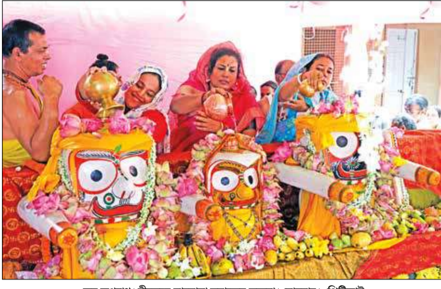
জয় জগন্নাথ। বীরভূমে মানবাধার করাচ্ছেন ভক্তরা। সোমবার।

কলকাতা, ২৯ জুন : তৃণমূল আমলের তৃণশিলি জাতি, উপজাতি ও অন্যান্য অনগ্রসর শ্রেণির শংসাপত্র যাচাইয়ে রাজ্য সরকার জানতে চাইল কলকাতা হাইকোর্ট।