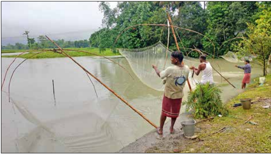
মাছ ধরার অনাবিল আনন্দ...