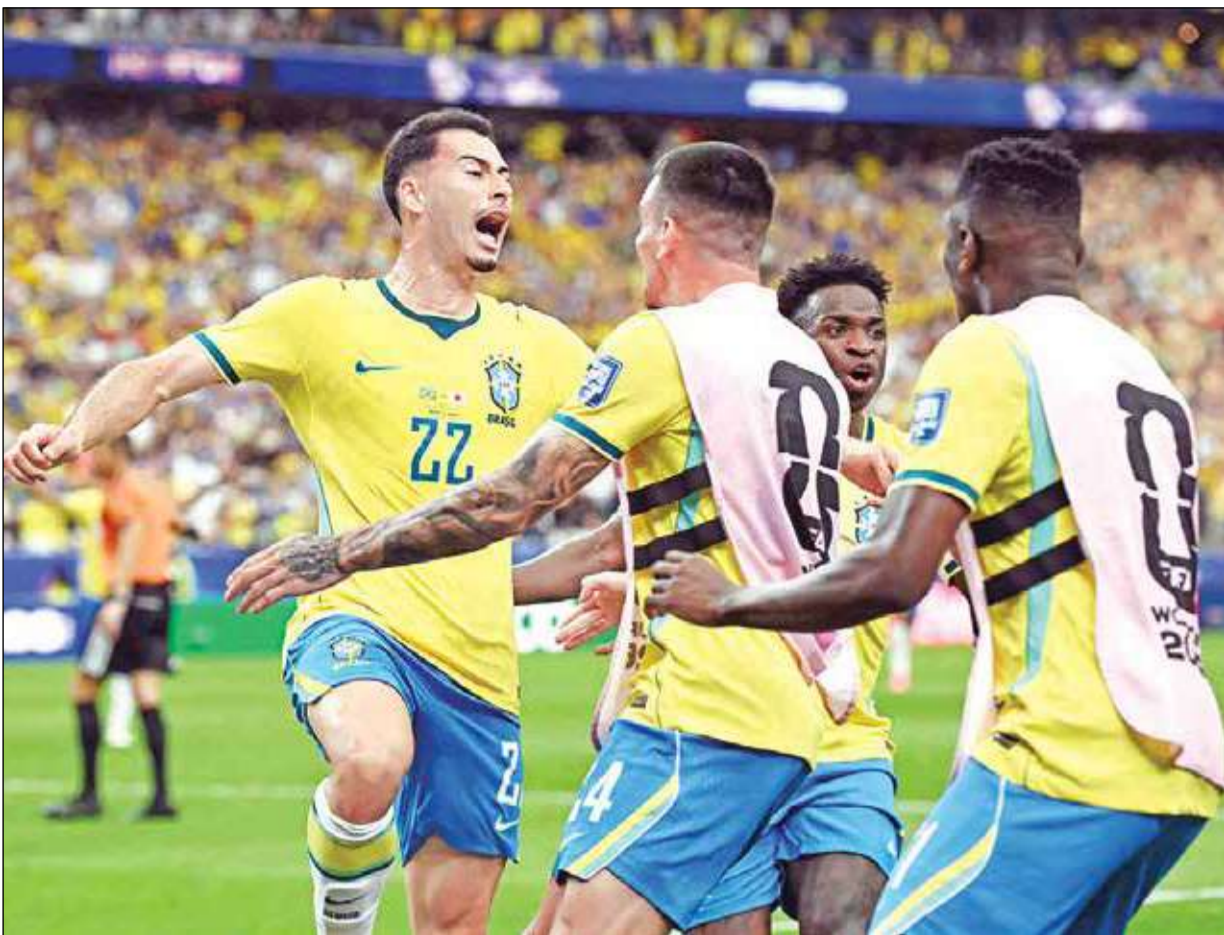
জাপানের বিরুদ্ধে দ্বিতীয়ার্ধের সংযোজিত সময়ে গোল করে ব্রাজিলের জয় আনলেন গ্যাব্রিয়েল মার্টিনেল্লি (২২)। হিউস্টনে সোমবার।