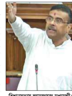
বিধানসভায় বমজাজে মুখ্যমন্ত্রী।

কলকাতা, ২৯ জুন : 'এনাক ইজ এনাক! কান খুলে শুনে রাখুন, মমতা বন্দ্যোপাধ্যায় আর মুখ্যমন্ত্রী নন যে দুর্বল প্রশাসন পেয়ে যা খুশি বলবেন।