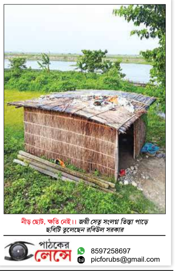
নীড় ছোট, ক্ষতি নেই। জম্মী সেতু সংলগ্ন তিস্তা পাড়ে