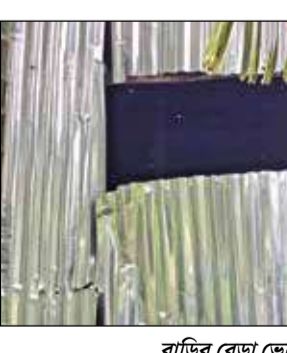
বাড়ির বেড়া ভেঙেছে হাতির পাল।

ফালাকাটা, ২৩ জুন : দুষ্কৃতীরা যেমন বিদ্যুৎ সংযোগ বিচ্ছিন্ন করে অন্ধকারে অপরামূলক কাজ করে তিক একই কায়দায় গ্রামে তাণ্ডব চালান হাতির দল। হাতির ভয়ে গ্রামে অনেকেই বাড়ির বাইরে বালব জালিয়ে রাখেন। আলো থাকায় সেই বাড়িতে ঢুকতে কিছুটা হলেও ভয় পায় গজরাজ। তাই এবার গাছ ফেলে ১১ হাজার কেভির বিদ্যুৎবাহী তারই ছিড়ে দিল হাতিরা। তারপর অন্ধকারে গ্রামে ঢুকে ঘর ভাঙল, জমির ফসল নষ্ট করল। সোমবার রাতে ফালাকাটার শিলাগোড় গ্রামে এমন ঘটনা ধামবাসীদের পাশাপাশি চিন্তা বাড়িয়েছে বন দপ্তরেরও। এজন্য ১৩ ঘণ্টা বিদ্যুৎহীন ছিল বিস্তীর্ণ এলাকা। এভাবে গাছ ফেলে তার ছেঁড়ায় হাতিদেরও বিদ্যুৎস্পৃষ্ট হওয়ার আশঙ্কা ছিল। বন দপ্তর অফিস রাতেই ৪-৫টি হাতিতে জব্দলয়ে ফেলল। জরুরিপাড়া সাউথ রেঞ্জের এক আধিকারিক বলেন, 'ব্যাংডাকি