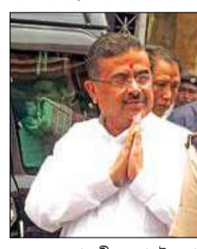
মুখ্যমন্ত্রীকে স্যালুট। কাণ্ডাতলা শ্মশানমাটে মঙ্গলবার।

মমতার পর শুভেন্দু পরোক্ষ অভিষেকের উদ্দেশ্যে তির ছোড়েন। তাঁর ভাষায়, 'আপনারা আন্দাজও ক্যামাক স্টিটে ও দুবাইয়ে।' ক্যামাক স্টিটে অভিষেক বন্দ্যোপাধ্যায়ের বাড়ি ও অফিস ছিলো। ফলে শুভেন্দুর ইঙ্গিত বুঝতে অসুবিধা হয় না। তাঁর পরের কথাগুলিতে মমতা ও অভিষেকের বিরুদ্ধে পরোক্ষ কড়া পদক্ষেপের বাতও স্পষ্ট। মুখ্যমন্ত্রী জানান, চর্চাটি অধিবেশনের শেষ দিনে দুর্নীতি রোধে আরও কড়া ব্যবস্থা গ্রহণ করার জন্য আইন আনা হচ্ছে। ওই আইন