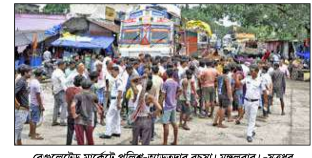
রেগুলেটেড মার্কেটে পুলিশি অভিযানের বচসা। মঙ্গলবার।