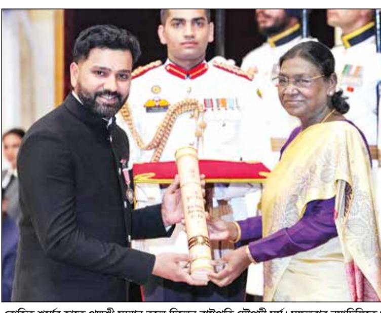
রোহিত শর্মার হাতে পদ্মশ্রী সম্মান তুলে দিলেন রাষ্ট্রপতি দ্রৌপদী মুর্মু। মঙ্গলবার নয়া দিল্লিতে।