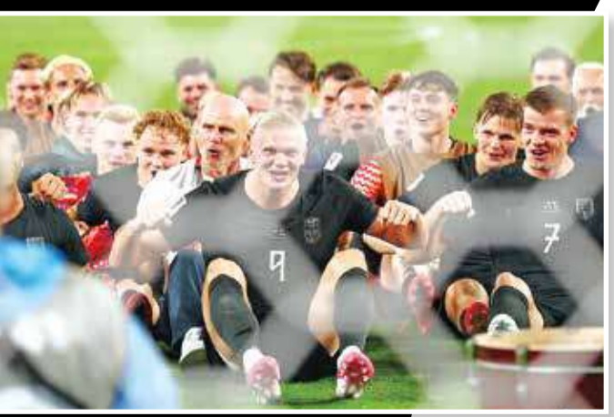
১৯৯৮ সালের পর প্রথমবার বিশ্বকাপের নকআউটে পৌঁছে ভাইকিং সেলিব্রেশনে মাতলেন নরওয়ের ফুটবলাররা।

ফ্রান্স সম্ভ্রত আমাদের হারিয়ে দেবে এবং এবার বিশ্বকাপটা হয়তো ওরাই জিতবে। ২৮ বছর পর নকআউটে ওঠাই আমাদের কাছে বড় সাফল্য। আমি এখন বিশ্বকাপ জেতার চেয়ে প্রতিটি মুহূর্ত উপভোগ করতে চাই। -আলিঁ ব্রাউট হাল্যান্ড