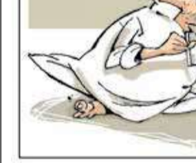
TMC Challenge Cup