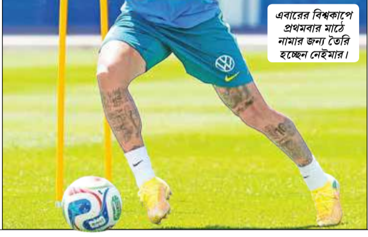
এবারের বিশ্বকাপে প্রথমবার মাঠে নামার জন্য তৈরি হচ্ছে নেইমার।