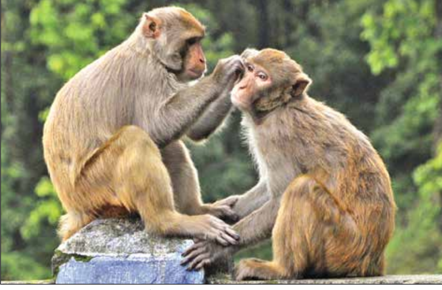
খুনশুটি। বৈকুণ্ঠপুর জঙ্গলের ফাড়াবাড়িতে। মঙ্গলবার।

শিলিগুড়ি, ২৩ জুন : কর ফাঁকি দিয়ে সিকিম থেকে দার্জিলিংয়ে মদ পাচারের হুক বানচাল করল আবগারি অধিকারিকরা দার্জিলিংয়ের গোট্টারস্ট্যাক এলাকায় দাঁড় করানো গাড়িটিকে জব্দ করে প্রচুর মদের বোতল বাজেয়াপ্ত করেন।