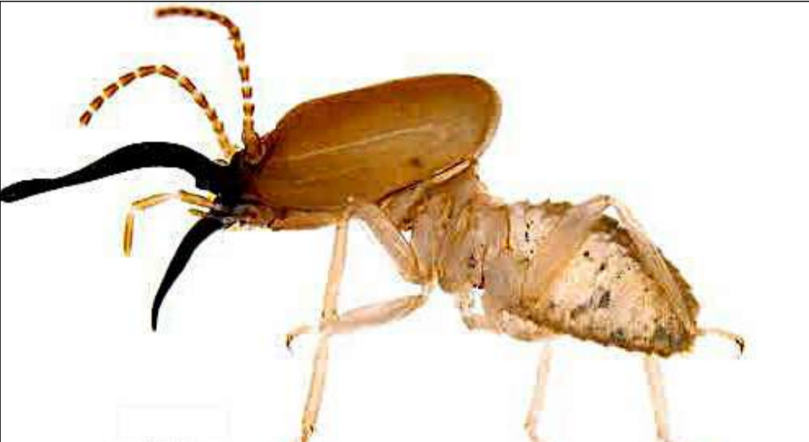
নতুন সন্ধান মেলা প্রজাতির উইপোকাকার সিডোজোকাপ্রিটামেস নোভাস।

পূর্ণেন্দু সরকার জলপাইগুড়ি, ১১ জুন : চাপড়ামারি জঙ্গলে উইপোকাকার এক নতুন প্রজাতি খুঁজে পেয়েছেন গবেষকদের একটি দল। গবেষকদের দলটি নতুন প্রজাতির উইপোকাকার নাম দিয়েছে সিডোজোকাপ্রিটামেস নোভাস। জঙ্গলে নিজের বিপদ বুঝলেই এই উইপোকাকার চোয়াল থেকে ক্লিক শব্দ করে। জুলজিক্যাল সোসাইটি, কলকাতা বিশ্ববিদ্যালয় এবং চার্চ মিশনারি সোসাইটি কলেজের যৌথ সমীক্ষায় এই নতুন প্রজাতির উইপোকাকার হৃদিস মিলেছে জলপাইগুড়ি জেলার নাগরাকটার চাপড়ামারি অভয়ারণ্যের গহন জঙ্গলের ভেতর।