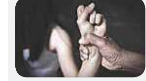
গত ৬ তারিখ ওই কিশোরী শালবাড়ির বাড়ি থেকে পালিয়ে যায়।