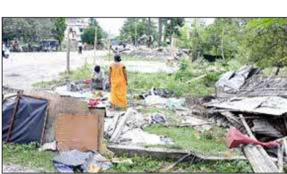
কাওয়াখালিতে ভাঙা হচ্ছে অবৈধ নির্মাণ। বৃহস্পতিবার।

শিলিগুড়ি, ১১ জুন : ফের জমি দখলমুক্ত করল শিলিগুড়ি-জলপাইগুড়ি উন্নয়ন কর্তৃপক্ষ (এসজেডিএ)। বৃহস্পতিবার কাওয়াখালিতে সিআরপিএফ ক্যাম্পের উলটো দিকে থাকা অবৈধ নির্মাণ ভেঙে দেওয়া হয়। আর্থমুভার দিয়ে ১০টি অবৈধ নির্মাণ ভেঙে দেওয়া হয়। যার মধ্যে তৃণমূল কংগ্রেসের অর্ধেক ভাঙা একটি পাটি অফিস, একটি ক্লাব ও বেশ কিছু খাবারের দোকান রয়েছে। আর্থিক দিক থেকে পিছিয়ে পড়া কিছু মানুষ ওই দোকানগুলি চালাচ্ছিলেন। যার মধ্যে ভাতের হোটেল, চা ও ফাস্ট ফুডের দোকান ছিল। উচ্ছেদের সময় অনেকে কান্নায় ভেঙে পড়েন। তাঁদের তরফে পুনর্বাসনের দাবি তোলা হয়েছে।