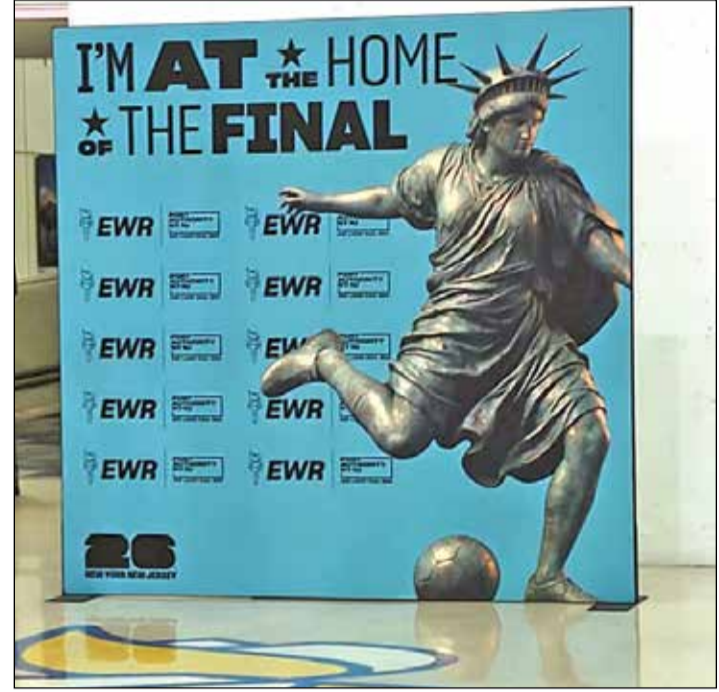
নিউজার্ক বিমানবন্দরে স্ট্যাচু অফ লিবার্টির এই ছবি নজর কেড়েছে।

কলকাতার খানাখন্দের নস্টালজিয়া এখনকার মানুষ মনে হয় অফিস করা ছাড়া বাড়িতে বসে শুধু খেলাই দেখবে! কিলোমিটার নয়, এখানে দূরত্বের হিসেব হয় মাইলে। ৩৮ মিনিটের সেই যাত্রাপথে মাইলের পর মাইল শুধুই যুটযুটে অঙ্ককার। গোটা রাস্তায় বিশ্বকাপের কোনও হোডিং বা ব্যানার চোখে পড়ল না। শুধু বিমানবন্দরে একটা বোর্ড নজরে