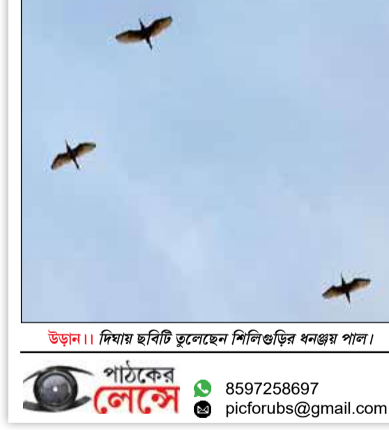
উডান। দিয়ার ছবিটি তুলেছেন শিলিগুড়ির ধনঞ্জয় পাল।

তৃণমূল জমানায় এসজেডিএ'র তরফে কাওয়াখালিতে একাধিকবার অবৈধ নির্মাণের বিরুদ্ধে অভিযান চলেছে। কিন্তু কোনওবারই এসজেডিএ'র আর্থমুভার তৃণমূলের পাটি অফিস বা ক্লাব স্পর্শ করেনি।