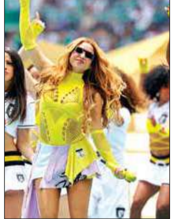
অ্যাড্ভেঞ্চার স্টেডিয়ামে শাকিরার নাচ, গানে ঢাকে কাটি পড়ল বিশ্বকাপের।

যাঁরা মাঠে বসে এই অনুষ্ঠান বা খেলা দেখার টিকিট জোগাড় করতে পারেননি, তাদের হতাশ হওয়ার কোনও কারণ নেই।