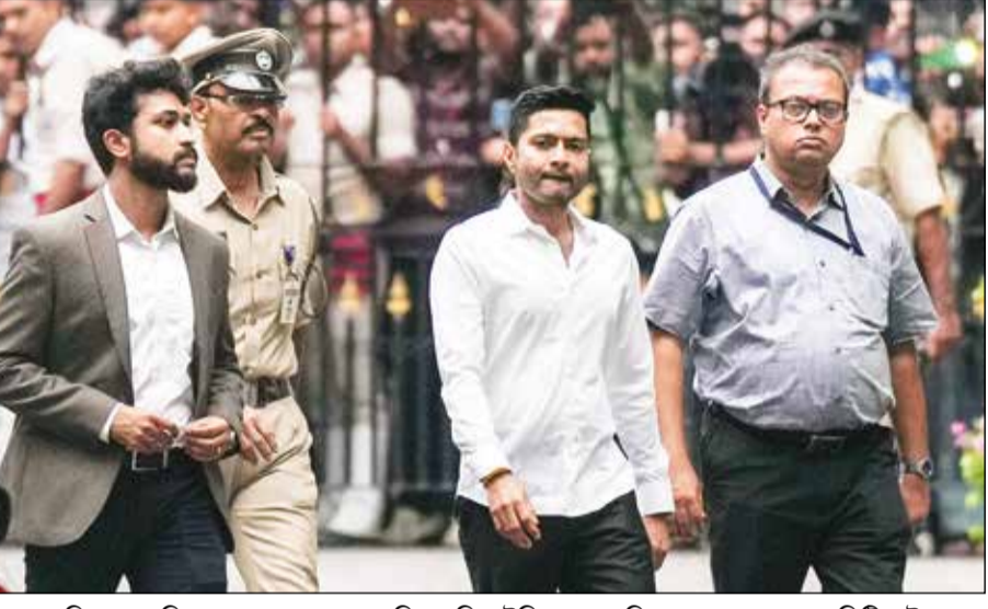
তিনবার হাজিরা এড়ানোর পর বৃহস্পতিবার সিআইডি দপ্তরে অভিষেক বন্দ্যোপাধ্যায়।