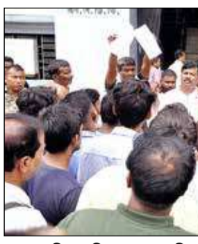
এসডিও অফিসের সামনে বিক্ষোভ টোটোচালকদের। বৃহস্পতিবার।

শিলিগুড়ি, ১১ জুন : সরকার পরিবর্তনের পরেই রাস্তার যানজট সমস্যার সমাধানে নেমেছে শিলিগুড়ি মেট্রোপলিটান ট্রাফিক পুলিশ। ইতিমধ্যেই হিলকার্ট রোডে টোটো চলার ওপর নিষেধাজ্ঞা জারি করেছে পুলিশ। এই পরিস্থিতিতে দৈনন্দিন আয়ে সরাসরি প্রভাব পড়ছে বলে অভিযোগে তুলে বৃহস্পতিবার বিক্ষোভ দেখালেন টোটোচালকরা। এদিন সকাল থেকেই সেবক রোডে টোটো পরিবেষা বন্ধ করে রাখেন চালকরা। সমস্ত টোটো সেবক রোডের পায়েল মোড় সংলগ্ন এলাকায় রেখে বিক্ষোভে শামিল হন টোটোচালকরা। এরপর সেবক রোড সহ শহরের বিভিন্ন জায়গার টোটোচালকরা মহকুমা