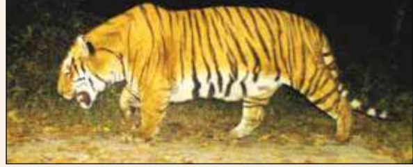
ট্রাপ ক্যামেরায় বক্সায় বাঘের অস্তিত্ব মিলেছিল।

যে রিপোর্ট দিয়েছিল সেখানে জানিয়েছিল ওরা জাতীয় উদ্যান, কাজিরাঙ্গা জাতীয় উদ্যান, মানস টাইগার রিজার্ভ থেকে বাঘ আনা যেতে পারে। কেননা পৃথিবী রাজ্য অসমের এই জঙ্গলের চরিত্রের সঙ্গে বক্সার জঙ্গলের চরিত্রের অনেকটাই মিল রয়েছে। আপাতত জঙ্গলে একটি এনক্লোজার করে বাঘ ছাড়া হবে বলে খবর। কয়েকদিন সেখানে থেকে বাঘ স্বাভাবিক পরিবেশে মিশে গেলে তারপর খোলা জঙ্গলে ছাড়া হতে পারে। তবে কোন জায়গা থেকে বাঘ আসবে বা ক'টা বাঘ আসবে সেটা এখনও জানায়নি বন দপ্তর। সূত্রের খবর, তিনটি বা ছয়টি বাঘ জঙ্গলে ছাড়া হতে পারে। সেক্ষেত্রে বাঘ ও বাঘিনীর অনুপাত থাকবে ১ঃ২।