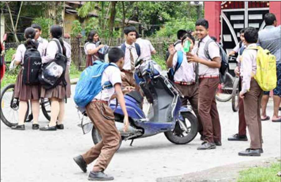
স্কুল ছুটির আনন্দ। আলিপুরদুয়ার জংশন এলাকায় বৃহস্পতিবার