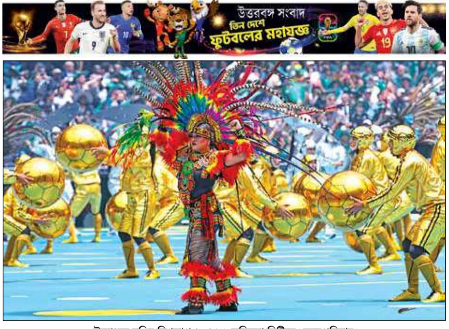
উদ্বোধনে রঙিন বিশ্বকাপ ২০২৬। মেক্সিকো সিটিতে। বৃহস্পতিবার।