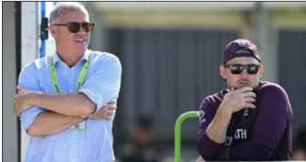
অ্যাসেজে পর্যদূত হয়ে মনমরা ইংল্যান্ড কোচ ব্রেন্ডন ম্যাককুলাম।

বলেছেন, ‘অ্যাসেজ জয়ের জন্য আমরা সবাই মুখিয়ে ছিলাম। পুরো শক্তি নিয়ে কাঁপিয়েছিলাম। গত ৪-৫ বছর ধরে দল ভালো ছপে রয়েছে। আশাবাদী, এই ধারাবাহিকতা বজায় থাকবে। ব্যাটিংয়ের পাশাপাশি দূরদৃষ্টি উইকেটকিপিং করল আলেক্স ক্যারি। মিচেল স্টার্ক অবিশ্বাস্য। উসমান খোয়াজার অভিষেক ম্যাচেও ছিলাম আমি। আজ এর বিপরী ম্যাচ। দারুণ ব্যাটার, দুদান্ত মানুষ হিসেবে সবাই ওকে মনে রাখবে।’