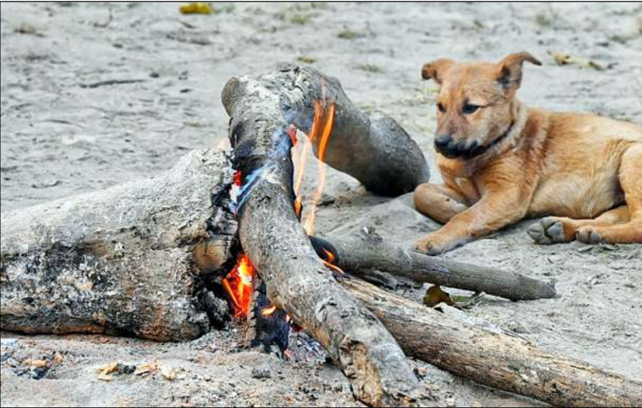
উষ্ণতার খোঁজে কুকুরছানাও। বৃহস্পতিবার রায়ডাক নদী সংলগ্ন এলাকায় অর্পণা গুহ রায়ের তোলা ছবি।

বন দপ্তর সূত্রে খবর, যেদিন থেকে শুমারি শুরু হবে সেদিন থেকে ৪৫ দিন পর্যন্ত ট্র্যাপ ক্যামেরাগুলিকে চালু রাখা হবে। ক্যামেরায় ওঠা বাঘের ছবি ওয়াইল্ডলাইফ ইনস্টিটিউট অফ ইন্ডিয়ায় গবেষণাগারে বিশ্লেষণ করে বাঘের সংখ্যা নির্ণয় করা হবে। এছাড়াও বাঘের মল, নখের আঁচড়, পায়ের ছাপ খতিয়ে দেখা হবে।