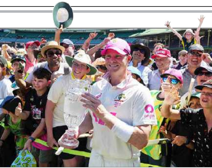
অ্যাসেজ জিতে ভক্তদের সঙ্গে অস্ট্রেলিয়ার সিডেন স্মিথ। বৃহস্পতিবার সিডনিতে।

ইংল্যান্ড-৩৮৪ ও ৩৪২ অস্ট্রেলিয়া-৫৬৭ ও ১৬১/৫ (অস্ট্রেলিয়া ৫ উইকেটে জয়ী)