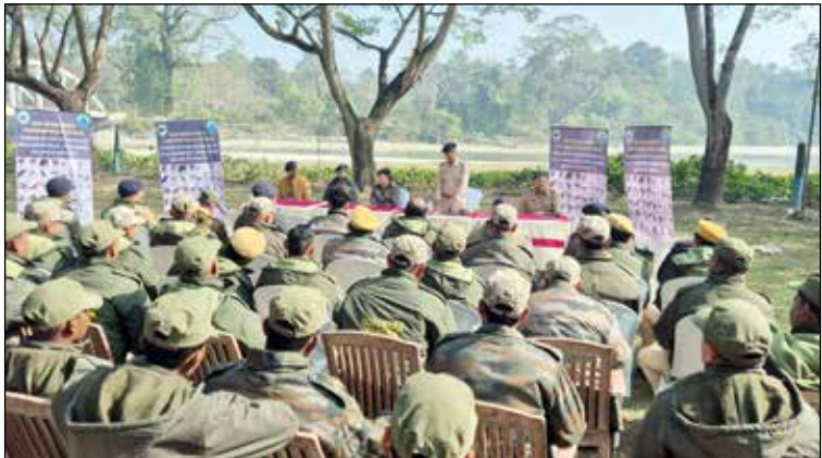
বাঘ শুমারির জন্য গরুমারায় বনকর্মীদের প্রশিক্ষণ।

বঙ্গা ব্যায়-প্রকল্পে একটি বাঘের অস্তিত্বের কথা ২০২৪ সালের বাঘ শুমারির রিপোর্টে উল্লেখ করা হয়েছিল। কিন্তু নেওড়াভালিতে ২০১৭ সাল থেকে মোবাইল ও ট্র্যাপ ক্যামেরায় গত বছর পর্যন্ত একাধিকবার বাঘের ছবি, মলের নমুনা পাওয়া গেলেও ২০২৪ সালের বাঘ শুমারি রিপোর্টে নেওড়ায় কোনও বাঘের