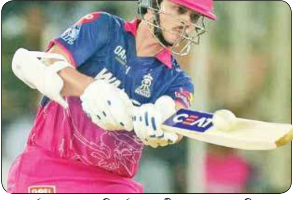
অর্ধশতরানের পথে রিভার্স স্লপ যশস্বী জয়সওয়ালের। শনিবার।