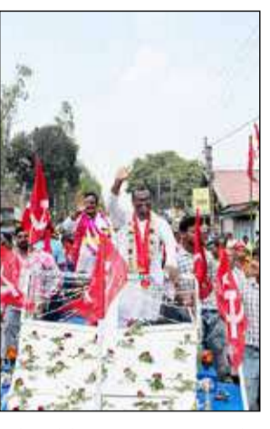
মনোনয়নপত্র জমা দিয়েছেন। এদিন তিনুতা মোড় থেকে বিজেপির মিছিল শুরু হয়। মিছিলে বণাঢ়ি ঢ্যাংবলোর ব্যবস্থা করা হয়েছিল। সেটা দেখতে সাধারণ