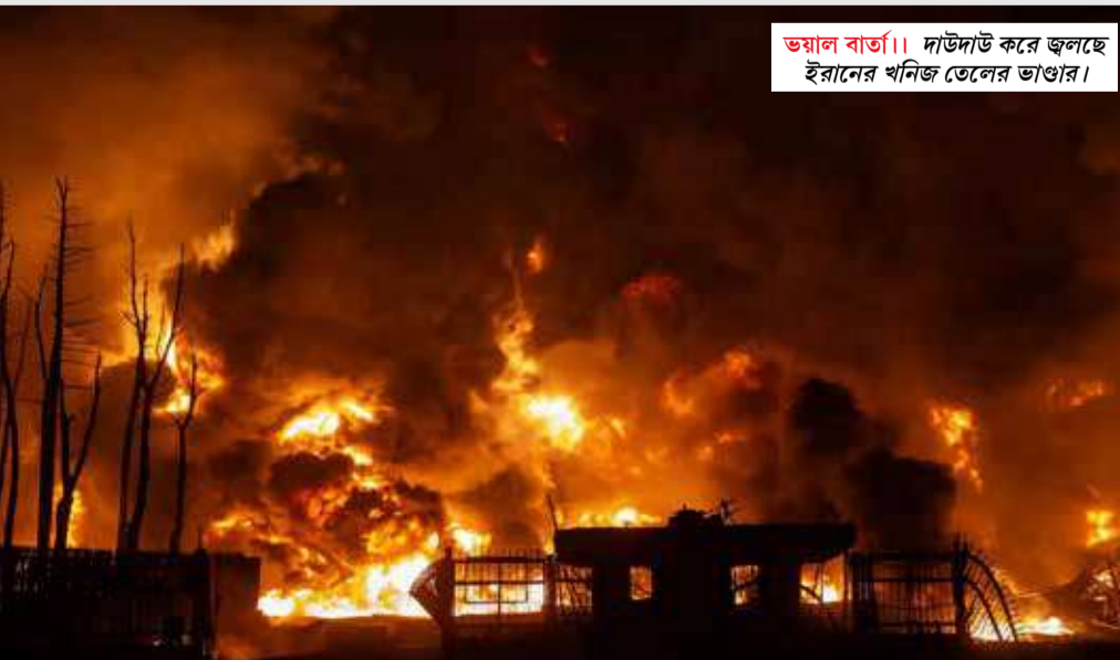
ভয়াল বার্তা। দাউদাউ করে জ্বলছে ইরানের খনিজ তেলের ভাণ্ডার।