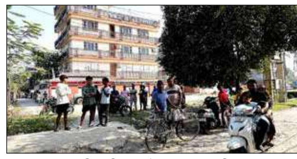
নানাবিধ পরিষেবা নেই ডাবগ্রাম-ফুলবাড়িতে।