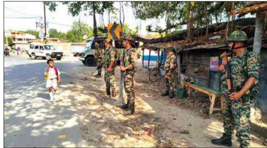
স্বাভাবিক ছন্দে ফেরার চেষ্টা।। কেন্দ্রীয় বাহিনীর কড়া প্রহরার মধ্যেই স্কুলযাত্রা খুঁদের।-সংবাদচিত্র

মোখাবাড়ি, ৪ এপ্রিল : মোখাবাড়িতে কালিয়াচক-২ ব্লক অফিসের সামনে যে অবরোধ চলছিল বুধবার রাতে, তা এখন রাজ্য রাজনীতির মোড় ঘুরিয়ে দিয়েছে। অবরোধ সকাল থেকে চললেও সন্ধ্যা অবধি তা নিয়ে খুব একটা উচ্চাচ্য হয়নি কোথাও। হইচই শুরু হয় তখন, যখন জানা যায় সেই বিভিন্ন অফিসে আটকে রয়েছেন সাতজন বিচারক। এবার প্রশ্ন উঠেছে, তাঁদের কি উদ্দেশ্যপ্রসোদিতভাবেই আটকে রাখা হয়েছিল? নাকি বিক্ষোভকারীরা জানতেন না, বিভিন্ন অফিসের ভেতরে কর্মী-আধিকারিকরা ছাড়াও বিচারকরাও রয়েছেন?