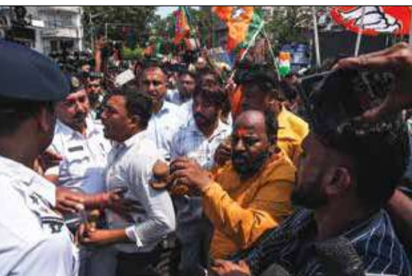
হাজার মোড়ে শুভেন্দুর মনোনয়নের দিন তৃণমূল-বিজেপির সংঘর্ষ। ফাইল চিত্র।

কলকাতা, ৪ এপ্রিল : কড়া বাত, হুঁশিয়ারিতেই থামল না কমিশন। অমিত শা-র উপস্থিতিতে শুভেন্দু অধিকারীর মনোনয়নের দিন গঙ্গোলের জেরে এক ডিসি সহ ৪ পুলিশকর্তাকে সাসপেন্ড করে দিল কমিশন।