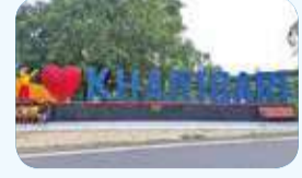
খড়িবাড়িতে কলেজ না থাকায় পড়ুয়াদের ভোগান্তি ক্রমেই বাড়ছে।

খড়িবাড়ি, ৪ এপ্রিল : ভোট আসে, ভোট যায়, কিন্তু প্রতিশ্রুতি আর শেষপর্যন্ত বাস্তবায়িত হয় না। প্রতিটি ভোটার আগে উন্নয়নের কথা বলা হলেও খড়িবাড়ি রকে এখনও একটি পূর্ণাঙ্গ কলেজ তৈরি হয়নি। কলেজ না থাকায় সাধারণ মানুষ ও তরুণ প্রজন্মের মধ্যে ক্ষোভ বাড়ছে।