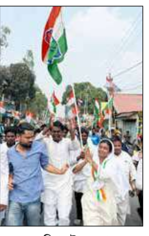
শনিবার ইসলামপুরে মনোনয়নপত্র পেশ করতে চলেছেন কংগ্রেস, সিপিএম ও বিজেপি প্রার্থীরা।