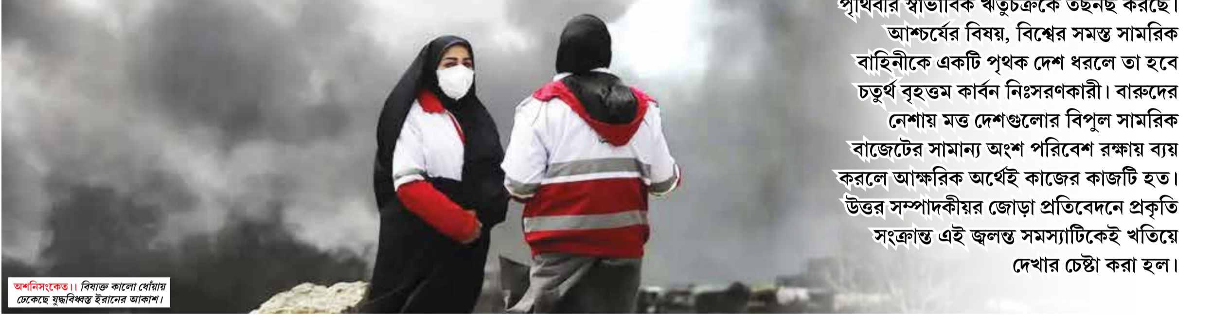
অশনিসংকেত। বিস্ময়কর। বিস্ময়কর। বিস্ময়কর।

যুদ্ধের দামামা বাজলে শুধু মানবসভ্যতা নয়, ক্ষতবিক্ষত হয় খোদ প্রকৃতিও। একদিকে যখন ইরানের আকাশে 'ব্ল্যাক রেইন' বা বিস্ময়কর কালো বৃষ্টির ঝকুটি, অন্যদিকে তখন সামরিক কার্বন নির্গমনে ঢাকা পড়ছে আন্তর্জাতিক পরিবেশ চুক্তিগুলোর উদ্দেশ্য। হিরোশিমা থেকে হালের ইউক্রেন বা মধ্যপ্রাচ্য— রণক্ষেত্রের বিস্ময়কর খোঁয়া আর তেজস্ক্রিয়তা পৃথিবীর স্বাভাবিক ঋতুচক্রকে তছনছ করছে। আশ্চর্যের বিষয়, বিশ্বের সমস্ত সামরিক বাহিনীকে একটি পৃথক দেশ ধরলে তা হবে চতুর্থ বৃহত্তম কার্বন নিঃসরণকারী। বারুদের নেশায় মত্ত দেশগুলোর বিপুল সামরিক বাজেটের সামান্য অংশ পরিবেশ রক্ষায় ব্যয় করলে আক্ষরিক অর্থেই কাজের কাজটি হত। উত্তর সম্পাদকীয়ের জোড়া প্রতিবেদনে প্রকৃতি সংক্রান্ত এই জ্বলন্ত সমস্যাটিকেই খতিয়ে দেখার চেষ্টা করা হল।