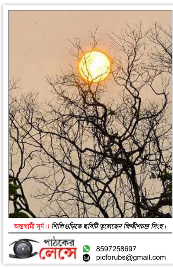
অন্ত্যগামী সূর্য।

শিলিগুড়ি, ৪ এপ্রিল : বেঙ্গালুরু থেকে আসতে যাওয়ার জন্য টিকিট কেটে বাসে উঠেছিলেন। সব টিকিট চলাছিল। শনিবার ওই বাস শিলিগুড়ি জংশনে এসে পৌঁছাতেই বাধল বিপত্তি। জংশনে এসে ওই ৬১ জন পরিযায়ী শ্রমিককে নামিয়ে দেওয়া হয় বলে অভিযোগ। ঘটনাকে কেন্দ্র করে এদিন জংশনে সাময়িক চাঞ্চল্য ছড়িয়ে পড়ে।