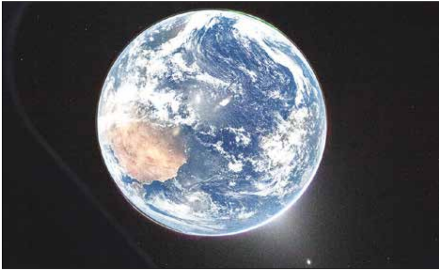
চাঁদের পথে পাড়ি দিয়ে মহাকাশ থেকে পৃথিবীর বিষয়ক ছবি পাঠালেন নাসার চার নভস্চর। নীল সমুদ্র আর সাধা মেঘের ভিড়ে ধরা পড়েছে সবুজ ঘেরা মেরুজ্যোতি বা অরোরার মায়াবী রূপ। দীর্ঘ ৫০ বছর পর 'আর্টেমিস-২' অভিযানে ফের চাঁদের মূলকে মানুষ পাঠানো নাসা। গরিয়ন মহাকাশযানে চেপে সোমবারের মধ্যেই চাঁদে পৌঁছে যাওয়ার কথা তাদের। ১০ দিনের এই অভিযানে মহাকাশচারীরা চাঁদে পানি দিলেও খুব কাছ থেকে উপগ্রহটিকে প্রদক্ষিণ করবেন। মাঝপথ থেকে পাঠানো তাদের এই ছবি এখন সমাজমাধ্যমে ভাইরাল।