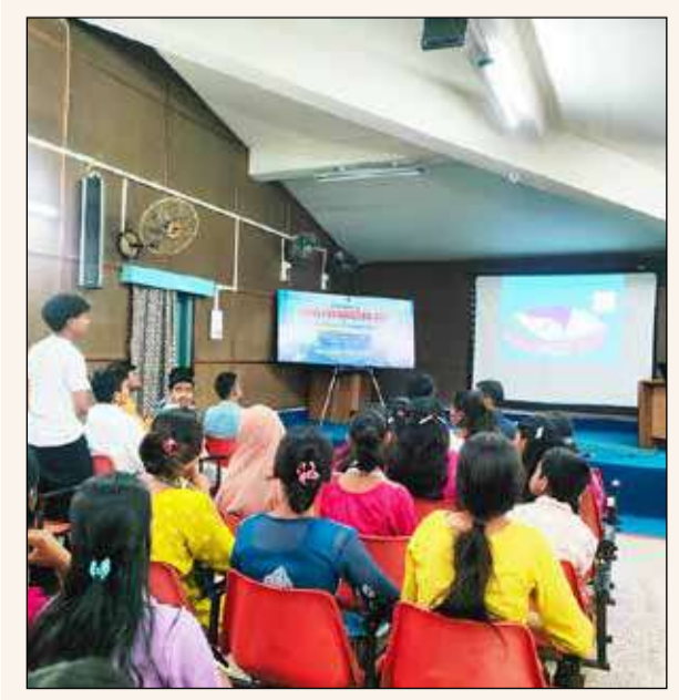
উত্তরবঙ্গ বিজ্ঞানকেন্দ্রে প্রতিষ্ঠা দিবসের কর্মসূচিতে পড়ুয়ারা।

তামালিকা দে শিলিগুড়ি, ৪ এপ্রিল : মজার পিছনে রয়েছে কঠিন বিজ্ঞান। তবে পড়ুয়াদের কাছে সহজ করতে মজার ছলে সেই বিজ্ঞান তুলে ধরল উত্তরবঙ্গ বিজ্ঞানকেন্দ্র। নাশানাল কাউন্সিল অফ সায়েন্স মিডিয়াজিয়ারের ৪৯তম প্রতিষ্ঠা দিবস উপলক্ষে শনিবার বিজ্ঞানমূলক অনুষ্ঠানের আয়োজন করা হয়। শিলিগুড়ি ও পাহাড় থেকে পড়ুয়ারা ওই অনুষ্ঠানে অংশগ্রহণ করল। বিজ্ঞান মানেই জটিল কোনও ব্যাপার ভেবে অনেক সময় পড়ুয়ারা ভয় পেয়ে যায়। কিন্তু মজার ছলে বিজ্ঞানের ম্যাজিক যদি পড়ুয়াদের সামনে তুলে ধরা হয় তাহলে তাদের সেব্যাপারে ভয়ের পরিবর্তে আগ্রহ জন্মাবে। এই ভাবনা থেকেই এদিন ম্যাজিক বিজ্ঞান শো দেখানো হয়। সাদা কাগজে জল স্প্রে করলেই ফুটে উঠেছে লেখা, বেলুনের তেতরে সূচ ঢোকালেও তা ফাটছে না আবার