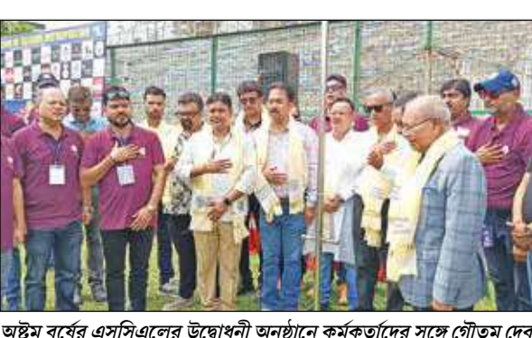
অষ্টম বর্ষের এসসিএলের উদ্বোধনী অনুষ্ঠানে কর্মকর্তাদের সঙ্গে সৌভাব্যে।