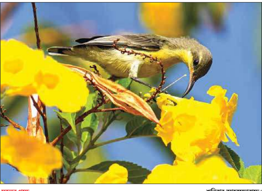
ফুলের গন্ধে... শনিবার আহমেদাবাদে।