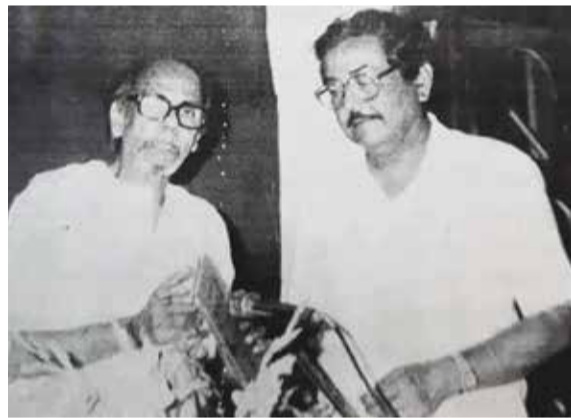
সোনালি স্মৃতি। সাহিত্যিক অমিয়ভূষণ মজুমদারের সঙ্গে।