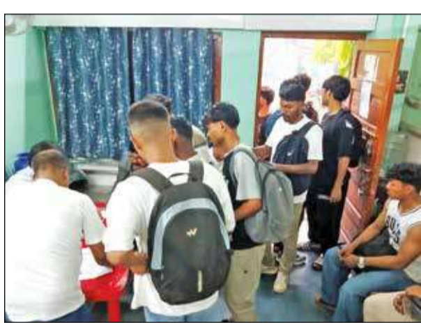
প্রথম ডিভিশন ফুটবল লিগের জন্য সই করতে শিলিগুড়ি মহকুমা ক্রীড়া পরিষদের দপ্তরে ভিড় (উপরে)। শক্তিশালী দল গড়ে জিটিএস ক্লাব।

সূর্য অপরদিকে মুম্বই ইন্ডিয়ান্সের তৃতীয় ব্যাটার (রোহিত, কায়রন পোলার্ডের পর) হিসেবে ১৫০টি ছক্কা মারার রুপে পা রাখেন। শেষদিকে নমন ধীর (২৮) রান পেলেও ইনিংসের গতি সেভাবে বাড়াতে পারেননি দিল্লির নিয়ন্ত্রিত বোলিংয়ের সামনে। শেষপর্যন্ত ১৬২/৬ স্কোরে থামকে যায় মুম্বই। রিজভির দাপটে যা কম পড়ে যায়।