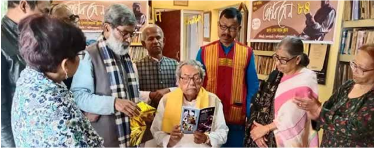
মধ্যমণি। এক সাহিত্যসভায়।