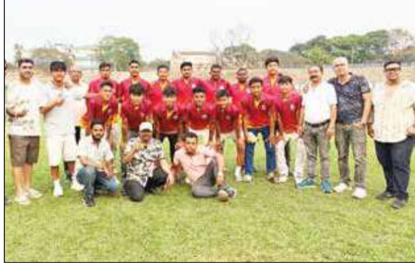
ফুটবল দলবদলে ১০০ জন