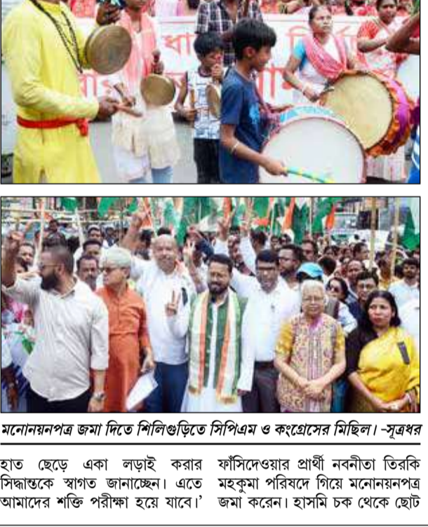
মনোনয়নপত্র জমা দিতে শিলিগুড়িতে সিপিএম ও কংগ্রেসের মিছিল।