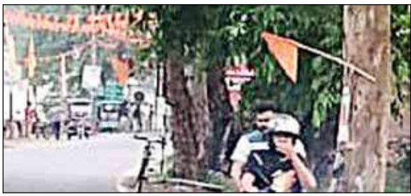
গাছে পেরেক পুঁতে লাগানো বাঁড়া।