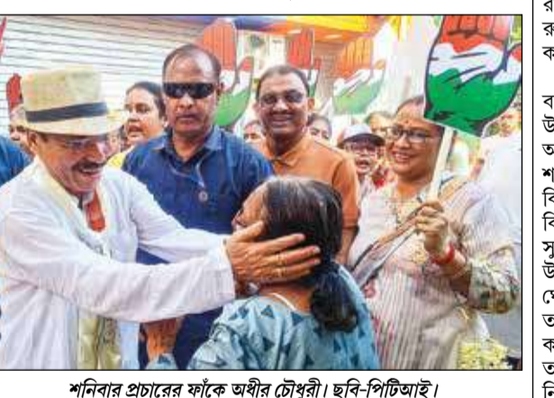
শনিবার প্রচারের ফাঁকে অধীর চৌধুরী।

পরে অধীর এক সাংবাদিক বৈঠকে বলেন, 'আমরা যে প্রচার কর্মসূচি গ্রহণ করি, সেগুলি নিবারণ কমিশন, পুলিশ সকলেই জানেন। সেখানে আমার যাত্রাপথে পরিকল্পিতভাবে বাধা সৃষ্টি করে মানুষকে ভাবতে চাইছে।