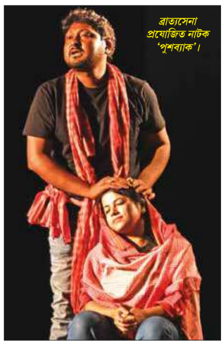
রাতাসেনা প্রযোজিত নাটক 'পুশব্যাক'।

মালাদা জেলা গ্রন্থাগারের পৃষ্ঠপোষকতায় বইবাগানে সম্প্রতি অনুষ্ঠিত হল 'আলোর উপল'-র