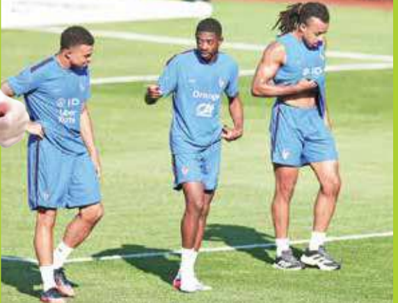
প্রি-কোয়ার্টার ফাইনালে প্যারাগুয়ে ম্যাচের প্রস্তুতিতে ফ্রান্সের কিলিয়ান এমবাপে, ওসমানে ডেহলে ও জুলেস কুন্দে।

৬ গোল করে কিলিয়ান এমবাপের সঙ্গে সোনার বুটের টক্করে লিওনেল মেসি।