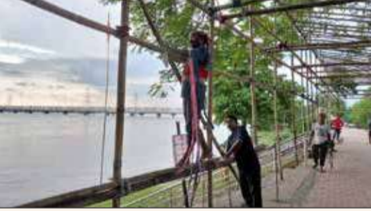
তিনাঘাটে পুণ্যার্থীদের জন্য প্যাভেল তৈরির কাজ চলাছে।

প্রসাদের আয়োজন করা হবে। গত বছর ভিডিরে চাপে বিশৃঙ্খল পরিষ্কার তৈরি হয়েছিল। তাই এবার পুলিশের কোনও আধিকারিকরা এলাকা পরিদর্শন করেছেন। মন্দিরে প্রবেশের পথে ব্যারিকেড অকে বৈধি মজবুত করা হচ্ছে। তিনা ঘট থেকে মন্দির সরলয় এলাকা সাজিয়ে তোলায় কাজ জোরকদমে চলাছে।