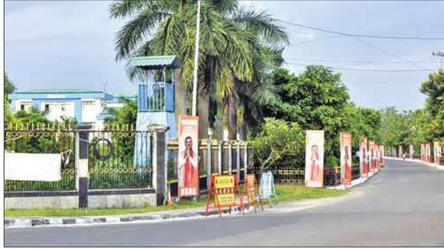
মুখ্যমন্ত্রীর আগমনে সেজে উঠেছে উত্তরকন্যার পাশের রাস্তা। শুক্রবার।

জিল, কিন্তু পুণ্যার্থীদের সুবিধার কথা মাথায় রেখে এ বছর সেই মূল্য ৪০ টাকা করা হয়েছে। পুণ্যার্থীরা লাইনে না দাঁড়িয়ে অনলাইনেই টিকিট কাটতে পারবেন। অনলাইন টিকিট ব্যবস্থার জন্য বিশেষজ্ঞদের সাহায্য নেওয়ার পাশাপাশি একটি ব্যাকের সঙ্গে কথা চলছে। মেলা চলাকালীন এক মাস ধরে স্বাস্থ্য পরিষেবা নিশ্চিত করতে দুটি হেলথ ক্যাম্প খোলা থাকবে। বয়স্ক পুণ্যার্থীদের পায়ের ব্যথা কমাতে ম্যাসাজের ব্যবস্থাও রাখা হয়েছে। দূরদূরান্ত থেকে আসা সাধুসন্তদের জন্য ভোগ ও