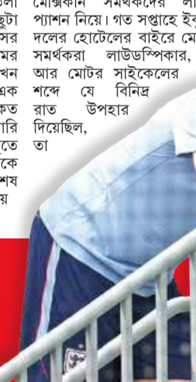
ফুটবল এখানে পৃথিবীর সব পথে এক করে দিয়েছে। মেস্সিকোর আবেগ বনাম ইংরেজদের নিখুঁত পরিকল্পনা আর কর্মকলের হিসাব মেলাবার এই লড়াইয়ে কে জিতবে, তা সময় বলবে।

ওঠা ইংল্যান্ডের জন্য এই মেস্সিকো তাই সম্পূর্ণ ভিন্ন এক যুদ্ধক্ষেত্র হতে চলেছে। মেস্সিকোর কাছে শেষ যোলোর এই গণ্ডিতা চিরকালই এক অলঙ্কারী হার্ডল। বারবার তিক এই জায়গাতেই তাদের বিশ্বকাপ স্বপ্ন ভেঙে চুরমাং হয়েছিল। কিন্তু এবার পরিস্থিতি ভিন্ন। নিজস্ব ঘরের মাঠে, দুর্ভেদ্য অ্যাজটেকা দুর্গে সেই ইতিহাস বদলাতে মরিয়া তারা। এই স্টেডিয়ামের সবুজ গালিচার মেস্সিকো প্রায় হারাই না। টমাস টুচেলের ইংল্যান্ড বিলম্বিত জানে, এই উচ্চতায় তারা কতটা হাঁসফাঁস করবে। এখানকার বাতাসে বলের গতিপথও বদলে যায়, বল ভাসে একটু বেশি। তাই উচ্চতার সঙ্গে মনিয়া মরিয়া মরিয়া চেষ্টায় তারা গুণ্ডাবারই চলে আসছে এই শহরে। তবে ইংরেজদের ভয় শুধু উচ্চতা বা অ্যাজটেকা নিয়ে নয়, তাদের বড় ভয় মেস্সিকান সমর্থকদের লাগামছাড়া প্যাননি নিয়ে। গত সপ্তাহে ইকুয়েডর তাদের হোটেলের বাইরে মেস্সিকান সমর্থকরা লাউউল্লসকার, হর্ন শার এর মোটর সাইকেলের সঙ্গে যে বিনোদিত রাতে উপহার দিয়েছিল, তা