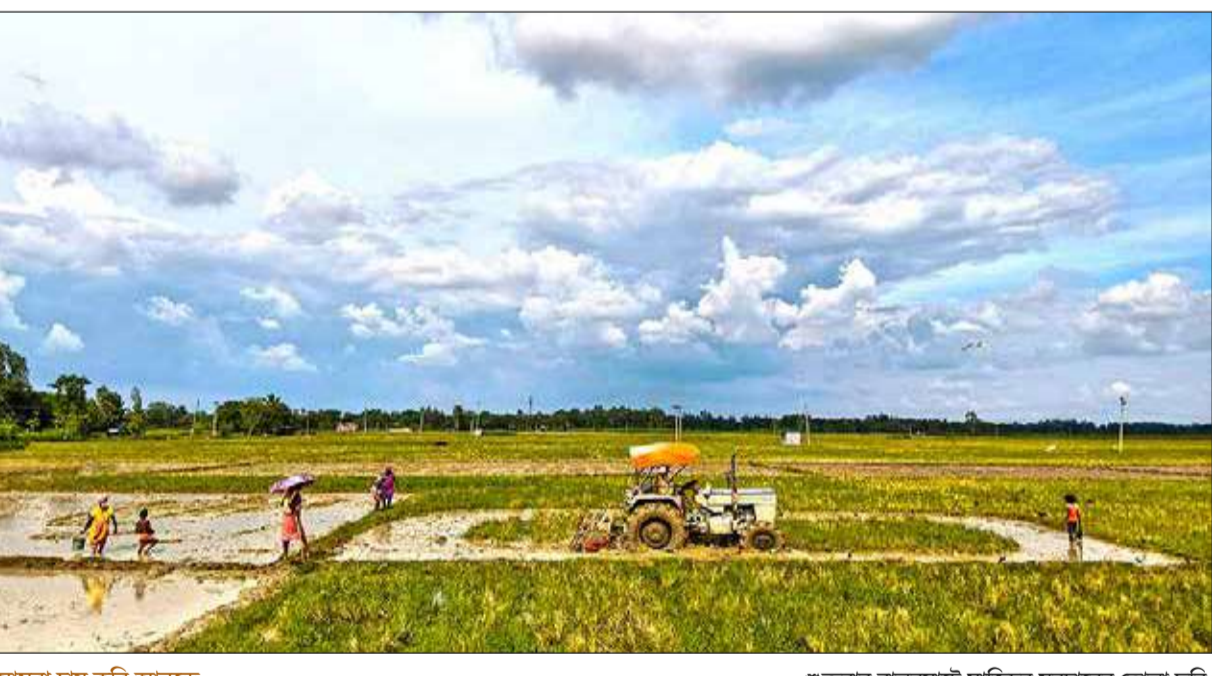
আমরা চাষ করি আনন্দে...