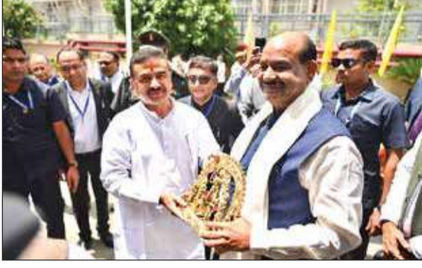
লোকসভার স্পিকার ওম বিড়লার সঙ্গে মুখ্যমন্ত্রী শুভেন্দু অধিকারী।