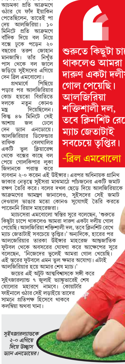
সুইজারল্যান্ডকে ২-০ এগিয়ে দিয়ে উজ্জ্বল ড্যান এনডোয়ের।

বিশ্বকাপে উত্তরবঙ্গ সংবাদ বান্ধিত্য সাহা