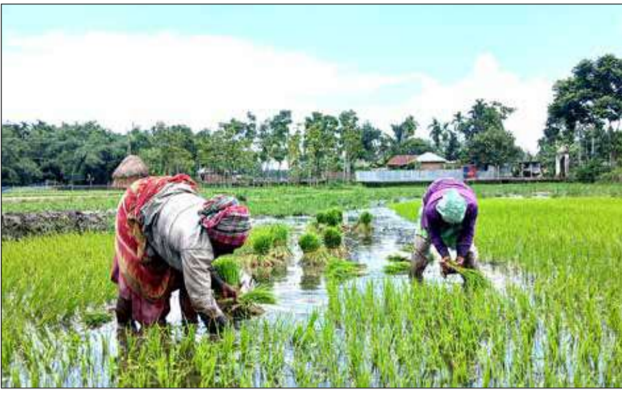
বয়সি খান রোপণ। শুক্রবার জলপাইগুড়ির পাহাড়পুরে বুয়া করার তোলা ছবি।

খড়িবাড়ি থানাবোরা মোড় এলাকায় আয়োজিত এই সহায়তাকেন্দ্রে স্থানীয় বাসিন্দাদের প্রচুর ভিডিও দেখা যায়।