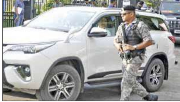
উত্তরকন্যায় বৈঠক শেষে বেরিয়ে যাচ্ছেন মুখ্যমন্ত্রী।