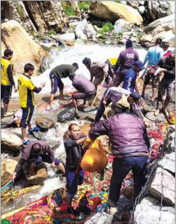
চারধাম যাত্রার আগে চলছে স্বচ্ছতা অভিযান। শুক্রবার যমুনোত্রী ধামে।

৪৩ বছরের এই নিরাপত্তারক্ষী বৃহস্পতিবার ভোরের দীর্ঘ ১০০ ঘণ্টার শ্বাসরুদ্ধকার অভিযানের পর তাঁকে জীবিত উদ্ধার করেন সাতটি দেশের বিশেষ উদ্ধারকারী দল। উদ্ধারকার গহ্বর থেকে উদ্ধার