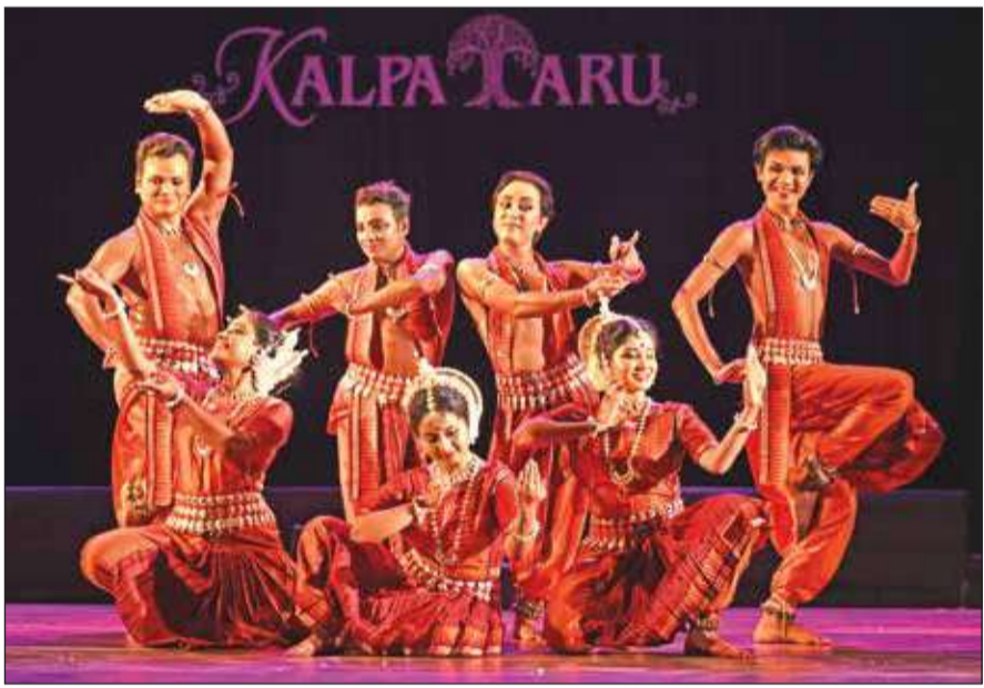
অনন্য। জলপাইগুড়িতে আয়োজিত 'কল্পতরু ২০২৬' সাংস্কৃতিক উৎসবের একটি মুহূর্ত।