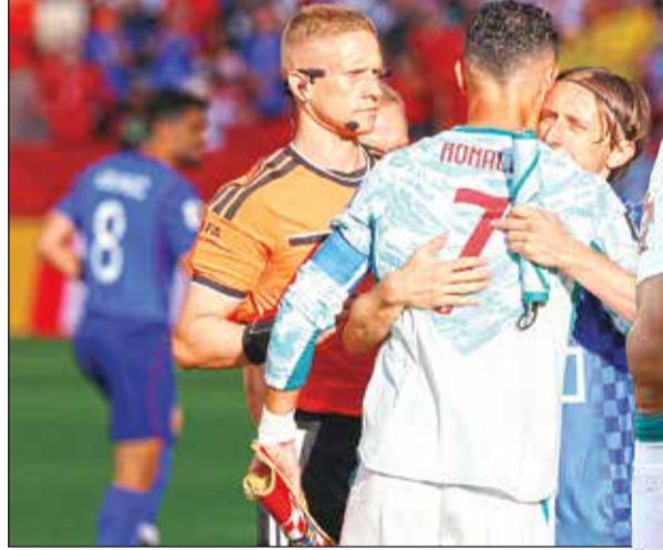
মাঠে শেষে লুকা মডরিচকে জড়িয়ে ধরলেন রোনাল্ডো।

মাঠে আলিঙ্গনরত অবস্থায় এবং এখনও যে মানের মডরিচের কানে ফিসফিস করে ফুটবল ও খেলছে, তা অবিশ্বাস্য। তিনি কী বলছিলেন, তা নিয়ে প্রবল কৌতূহল ছিল। মিস্ত্র ড্রোনে তিনি অন্যরকম হাতেই পারত।