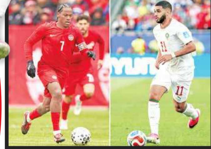
এবারের বিশ্বকাপে ৩টি করে গোল করা কানাডার জোনাকন ডেভিডের (বামে) সঙ্গে আজ সন্ধ্যা সমরে নামছেন মরক্কোর ইসমায়েল সাইবার।