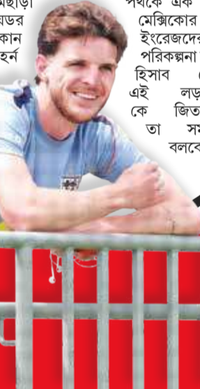
ফুটবল এখানে পৃথিবীর সব পথে এক করে দিয়েছে। মেস্সিকোর আবেগ বনাম ইংরেজদের নিখুঁত পরিকল্পনা আর কর্মকলের হিসাব মেলাবার এই লড়াইয়ে কে জিতবে, তা সময় বলবে।

থেকে শিক্ষা নিয়েছে থ্রি লায়ন্স। তাই এবার ইংল্যান্ডের হোটেলের নাম সম্পূর্ণ গোপন রাখা হয়েছে। ফুটবলারদের শান্তিতে ঘুমোনার জন্য থাকছে হোয়াইট নয়েজ মেশিন আর ইয়ারপ্লাগ। এই রাজপথ আর কংক্রিটের জঙ্গলে কান পাতলে এখনও ৪০ বছর আগের এক অজুত ইতিহাস শোনা যায়। ১৯৮৬ সালে এই অ্যাজটেকাতেই দিয়েসো মারাডোনার সেই বিখ্যাত 'হ্যান্ড অফ গড' আর শতাব্দীসেরা গোলের কাছের পরাস্ত হয়ে বিদায় নিয়েছিল ইংল্যান্ড। টুচেল মনে করছেন, প্রকৃতির এক অমোঘ নিয়ম বা কর্মফল এবার তাদের সহায় হবে। তাঁর বিশ্বাস, সেদিনের সেই বন্ধকার জবাব এবার এই মাঠেই ফেরত পাবে ইংল্যান্ড। ফুটবল এখানে পৃথিবীর সব পথে এক করে দিয়েছে। মেস্সিকোর আবেগ বনাম ইংরেজদের নিখুঁত পরিকল্পনা আর কর্মকলের হিসাব মেলাবার এই লড়াইয়ে কে জিতবে, তা সময় বলবে।