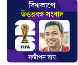
বিশ্বকাপে উত্তরবঙ্গ সংবাদ সন্দীপন রায়

মাঠে আলিঙ্গনরত অবস্থায় এবং এখনও যে মানের মডরিচের কানে ফিসফিস করে ফুটবল ও খেলছে, তা অবিশ্বাস্য। তিনি কী বলছিলেন, তা নিয়ে প্রবল কৌতূহল ছিল। মিস্ত্র ড্রোনে তিনি অন্যরকম হাতেই পারত।