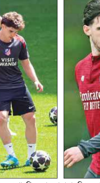
একে অপরের মুখোমুখি হওয়ার আগে প্রস্তুতিতে অ্যাটলেটিকো মাদ্রিদের জুলিয়ান আলভারাজ (বামে) ও আর্সেনালের ডেকলান রাইস।