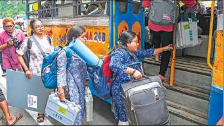
বুধের পথে মহিলা ভোটকর্মীরা। কলকাতায় মঙ্গলবার।

দ্বিতীয় দফায় রাজ্যে ৩,২২,১৫,২৬০ ■ পুরুষ ১৬৪৭৪০৩৬ ■ মহিলা ১৫৭৪০১৬২ ■ তৃতীয় লিঙ্গ ৭৯২