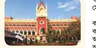
কল্যাণের অভিযোগ, টার্গেট করা হয়েছে ভবানীপুর বিধানসভাকে।

কলকাতা, ২৮ এপ্রিল : দ্বিতীয় দফার ভোটের আগে সমস্যা সৃষ্টিকারীদের নামের তালিকা প্রকাশ তৃণমূলের দায়ের করা মামলায় কোনও নির্দেশ দিল না কলকাতা হাইকোর্ট।