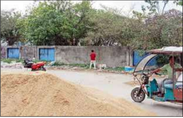
ধান কেনাবেচার বাজারেই শৌচকর্ম।