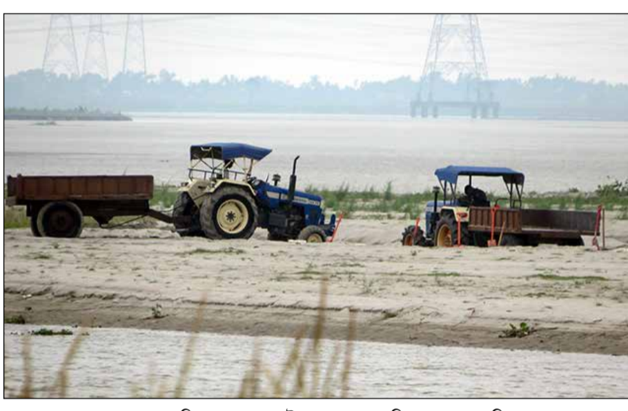
বাসুসুভায় তিস্তা থেকে এভাবেই চলছে অবাধে বালি তোলা। -সংবাদচিত্র

জলপাইগুড়ি, ২৮ এপ্রিল : বর্ষা মোকাবিলায় আগাম প্রস্তুতি শুরু উত্তর-পূর্ব সীমান্ত রেল। দুর্বল সেতু চিহ্নিত করে প্রয়োজনীয় ব্যবস্থা নেওয়া থেকে ভূমিধস রোধে সংশ্লিষ্ট এলাকাগুলিতে বোম্বার মজুত রাখা, যাতে একমাসের বেশি সময় থাকলেও বর্ষা মোকাবিলায় কাজ শুরু করে দিয়েছে রেল। উত্তরবঙ্গ সহ উত্তর-পূর্ব ভারতে ভারী বর্ষাতেও যাতে ট্রেন চলাচল স্বাভাবিক রাখা যায়, তার জন্যই এমন পদক্ষেপ। এবার আবহাওয়া দপ্তরের সঙ্গে সমন্বয় রেখে কাজ করার সিদ্ধান্ত নিয়েছে রেল।