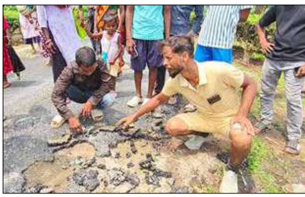
বালি লাইনে রাস্তার পিচ তুলে প্রতিবাদ চা শ্রমিকদের। -সংবাদচিত্র

এদিকে সংশ্লিষ্ট সূত্রে জানা গিয়েছে, ডুয়ার্সের কয়েকটি বাগান দুটি ছুটিই সবেতন দেবে বলে জানিয়েছে। এক্ষেত্রে প্রশ্ন উঠছে তাহলে সিংহভাগ বাগানের দিতে অসুবিধে কোথায়? দার্জিলিংয়ের নীর্ষ চা বণিকসভা ডিউটি চলতি বছরে এপ্রিল মাসেই তাদের সদস্য বাগানগুলিকে একটি সার্কুলার জারি করে বৃদ্ধপূর্ণিমার সবেতন ছুটি ২ মে দেওয়ার কথা জানিয়েছিল।