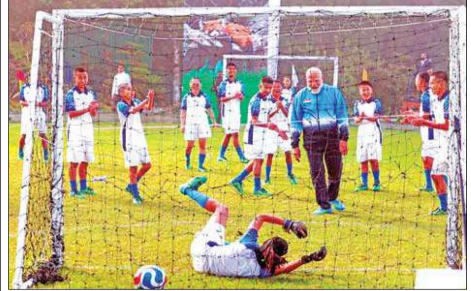
বঙ্গের ভোটপ্রচার শেষে সিকিম সফরে গিয়ে ফুটবলে মজলেন প্রধানমন্ত্রী নরেন্দ্র মোদি। দিলেন গোলও। মঙ্গলবার গ্যাংটকে।