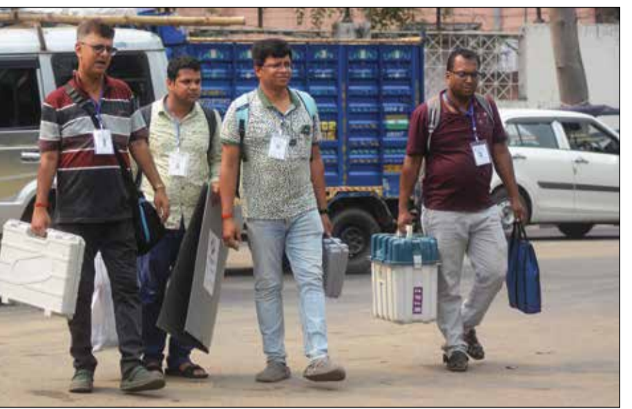
দলবেঁধে বুকের পথে। মঙ্গলবার কলকাতায়।

ভালা লাগছে আপনি ফাণ্টার সাইলে ফুটি করছেন। ঠান্ডা ঠান্ডা কুল থাকুন। মনে রাখবেন বাংলায় সবসময় তৃণমূল।