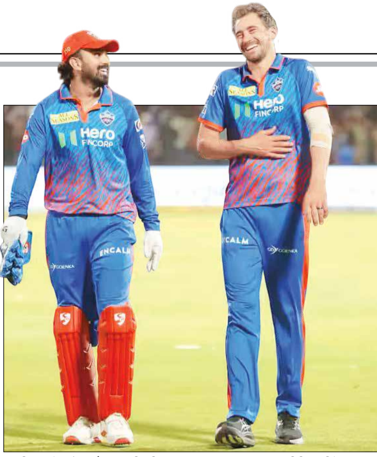
মিচেল স্টার্কের মাঠে ফেরার দিন নিয়ে সংশয় এখনও বজায় রয়েছে। দিল্লি ক্যাপিটালসের বিপর্যয়ের দিনে সতীর্থ লোকেশ রাহুলদের পাশে অজি তারকা। নমাদিল্লিতে।