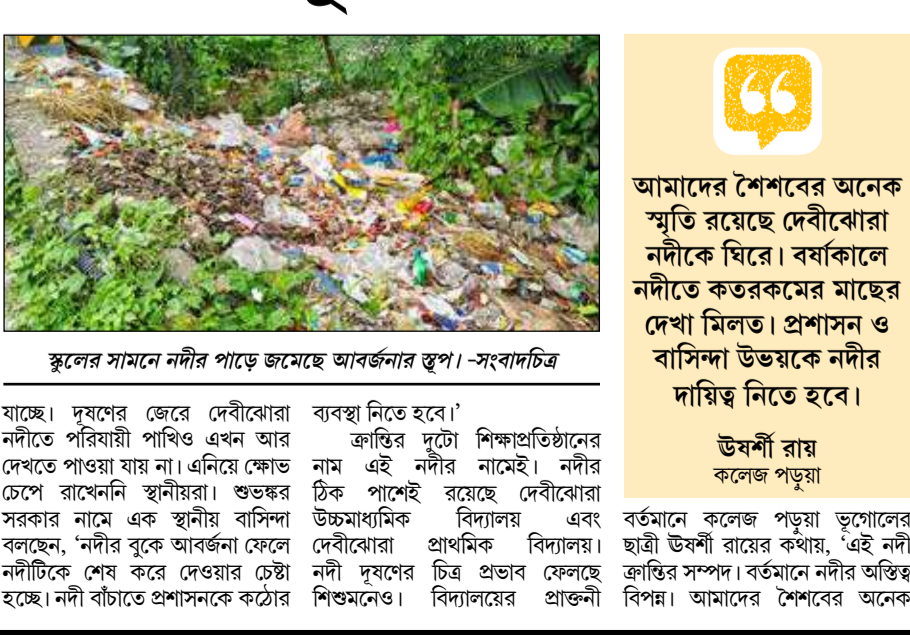
স্কুলের সামনে নদীর পাড়ে জমেছে আবর্জনার স্তুপ। -সংবাদচিত্র

ক্রান্তি, ২৮ এপ্রিল : আবর্জনার ক্রমশ দমবন্ধ হয়ে আসছে নদীর। এক সময়ে যে দেবীঝোরা স্রোতস্রী ছিল, এখন সেই নদীর বুকে যাওয়ার উপক্রম হয়েছে। আবর্জনার নদী কার্যত তার অস্তিত্ব হারাতে বসেছে। অভিযোগ উঠছে, ক্রান্তির স্থানীয় ব্যবসায়ীদের একাংশ নদীতে আবর্জনা ফেলছে। অবশ্য গ্রাম পঞ্চায়েতের প্রধানের বক্তব্য, বারবার নিষেধ করা সত্ত্বেও অনেকে আবর্জনা ফেলা বন্ধ করেননি। তাদের বিরুদ্ধে কড়া পদক্ষেপের হুঁশিয়ারি দিয়েছেন তিনি। যদিও অনেকেই বলছেন, শুধু হুঁশিয়ারিতেই কাজ হবে না। পদক্ষেপ না করলে নদীটাই এক সময়ে আবর্জনার চাপা পড়ে যাবে। একসময় এই নদীতে পাওয়া যেত সুস্বাদু নদীমাছ মাছ। কিন্তু নদী দুধের ফলে এখন সেইসব মাছ হারিয়ে