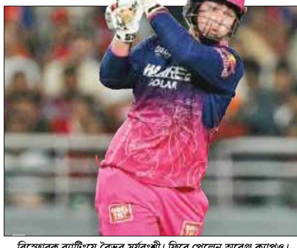
বিশ্বফারক ব্যাটিংয়ে বৈভব সূর্যবংশী। ফিরে পেলেন অরেঞ্জ ক্যাপ।