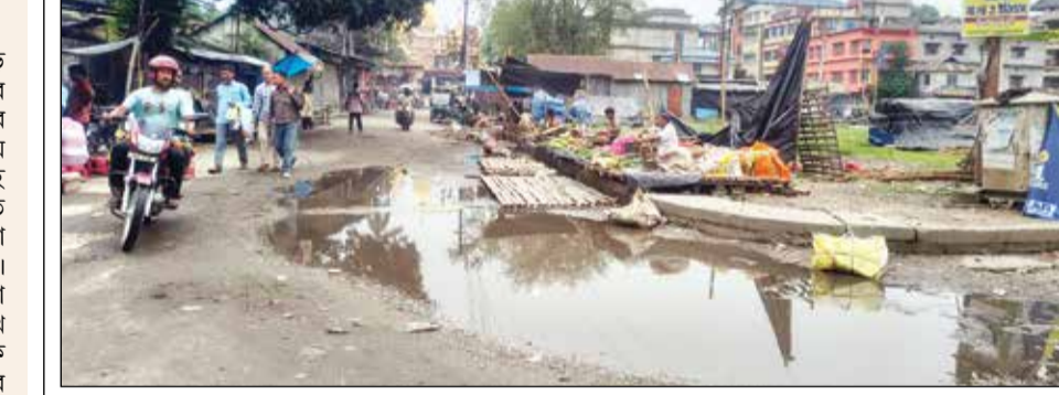
পুরসভার উদাসীনতায় এভাবেই রাস্তায় জমে থাকে বৃষ্টির জল।