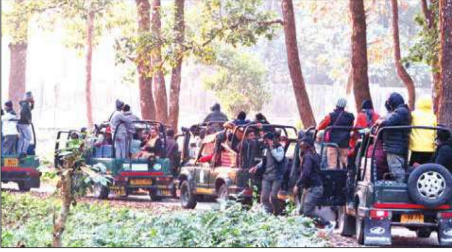
বিশেষ দিনে জঙ্গল সাফারিতে ভিড় হলেও সামগ্রিকভাবে পর্যটকের আনাগোনা কমছে গরুমারা-লাটাগুড়িতে।

লাটাগুড়ি, ৩১ ডিসেম্বর : দিন-দিন গরুমারায় কমছে পর্যটকের সংখ্যা। ছুটির ভরা মরশুমে শীতের আমেজ গিয়ে মেখে প্রচুর পর্যটক উত্তরবঙ্গমুখী হলেও তার প্রভাব পড়ছে না গরুমারায়। স্থানীয় পর্যটন ব্যবসায়ীদের এবং বিভিন্ন বনবস্তির বাসিন্দাদের আয়ের হিসাব অসুস্থ তাই বলছে। গত কয়েক বছর আগেও ডুরাসের প্রাণকেন্দ্র গরুমারায় পর্যটকদের ভিড় উপচে পড়ত। বন দপ্তরের পরিসংখ্যান বলছে, ২০১৮ সালে গরুমারায় প্রায় ৬০ হাজারের ওপর পর্যটক বেড়াতে এসেছিলেন। কিন্তু করোনা পরবর্তী সময়ে প্রতি বছর সেই সংখ্যাটা ধীরে ধীরে ৩০ থেকে ৩৫ হাজারে নেমে এসেছে। এদিকে, গরুমারাকে কেন্দ্র করে একের পর এক রিসর্ট-হোটেল ইত্যাদি তৈরি হচ্ছে। কিন্তু অভিযোগ, রাজ্য ও রাজ্যের বাইরে সরকারি তরফে গরুমারাকে নিয়ে প্রচারের অভাব রয়েছে।