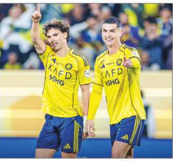
আল নাসেরের দুই গোলস্কোরার জোয়াও ফেলিসও ত্রিশচিয়ানো রোনাল্ডো।

রিয়াজ, ৩১ ডিসেম্বর: বছরের প্রথম ম্যাচে গোল পেয়েছিলেন। বছরের শেষ ম্যাচেও গোল পেলেন পর্তুগিজ মহাতারকা ক্রিসচিয়ানো রোনাল্ডো।