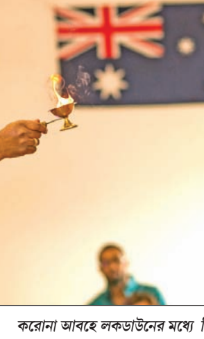
করোনা আবহে লকডাউনের মধ্যে ভিডিওয়ে ঘরেই সারতে হয়েছে দুর্গাপূজা।