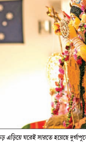
ইন্ড ক্লাব উইলিংহাম, ২০১৯-এ উৎসব

দশমী, বিসর্জন। প্রতি বছর কলকাতা থেকে প্রতিমা নিয়ে আসা যেহেতু সম্ভব হয়নি তাই বিসর্জন হয় ঘরেই। আর প্রতিমা প্যাকিং হয়ে চলে যায় কোনও বাঙালি এক জায়গায় হলেই দুর্গাপূজা হয় আর চতুর্থাংশ তাতে যোগ দিলেই শুরু হয় দ্বিতীয় দুর্গাপূজা।