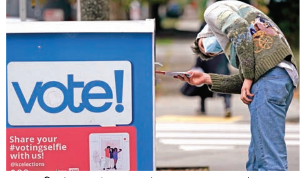
সিয়াটেলে ব্যালট পেপার ভোট বাজ়ে ফেলাছেন এক ভোটার।

ওয়শিংটন, ২৯ অক্টোবর : এইচ-১বি ভিসা পদ্ধতিতে ফের রদবদল করছে ডোনাল্ড ট্রাম্প প্রশাসন। আমেরিকার জাতীয় নিরাপত্তা দপ্তর (ডিএইচএস)-এর প্রস্তাব অনুযায়ী, এইচ-১বি ভিসা দেওয়ার ক্ষেত্রে কম্পিউটার ভিত্তিক লটারি ব্যবস্থা তুলে দিয়ে তিনদেশি তথ্যপ্রযুক্তি কর্মীদের বেতন কাঠামো বিবেচনা করা হতে পারে। এর ফলে মার্কিন নাগরিকদের কম বেতনে কাজ করার বাধ্যবাধকতা কম যাবে বলে মনে করা হচ্ছে। বুধবার হোমল্যান্ড সিকিউরিটি দপ্তরের এক বিবৃতিতে জানানো হয়েছে, আগামী একসময় এই বিজ্ঞপ্তি জারি করার মাধ্যমে মার্কিন পদ্ধতি সম্পর্কে মতামত দিতে হবে। প্রেসিডেন্ট নির্বাচনের এক সপ্তাহ আগে এই বিজ্ঞপ্তি জারি করার মাধ্যমে মার্কিন পেশাদারদের সম্মতি করার চেষ্টা হল বলে মনে করা হচ্ছে। এই নিয়ম কার্যকর হলে ভারতীয় তথ্যপ্রযুক্তি কর্মীরা আনুষ্ঠানিক পড়বেন। এইচ-১বি ভিসা চালা হয়েছিল জর্জ এইচউব্লিউ বুশের জন্মদিন। সেই সময় মার্কিন মূলুকে তথ্যপ্রযুক্তি শিল্পে জোয়ার এসেছিল। কিন্তু কাজের জন্য দক্ষ কর্মীর অভাব ছিল। সেই অভাব পূরণ করতে ভারত, চীন সহ নানা