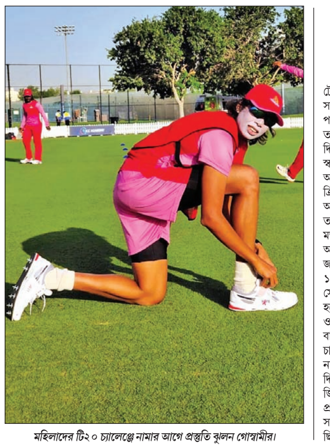
মহিলাদের টি২০ চ্যালেঞ্জে নামার আগে প্রস্তুতি বুলন গোবামারী।

নায়ক জাদেকা। ১১ বলে অপরাধিত ৩১-এর ম্যাচ জেতানো ইনিংস শেষে চেম্বাইয়ের স্পিন-অলরাউন্ডার বলেন, 'নেটে এই ধরনের শট খেলে থাকি। শেষদিকে সেটাই করেছি। শেষ ১২ বলে ভাবার সময় ছিল না। বল দেখা আর চালাও। নিজের শক্তির ওপর ভরসা রেখেছিলাম। জানতাম, ওরা যদি আমার নাগালের মধ্যে বল রাখে, ছক্কা হাঁকা। ইনিংসটা খেলতে পেরে, দলকে জিতিয়ে আমি তুষ্ট।' জিতিকে যাওয়ার পর স্বস্তির জয়ে খুশির ঝলক মাহেশ্বর সিং যোনির মুখেও। বলেন, 'এদিন আমাদের প্ল্যান কাজ করেছে। প্রত্যেকেই মরিয়া ছিল। তার প্রতিফলন ফলাফলে। চলতি আইপিএলে জাদেকা দুর্দান্ত। দলের একমাত্র ব্যাটসম্যান যে ডেথ ওভারে বড় তুলেছে। শুধু শক্তি নয়, ফিফ্টিং অনুযায়ী শটগুলি খেলেছে ও। রুতুরাজ গায়কোয়াড়ও অত্যন্ত প্রতিভাবান। কোভিডের জন্য দিন কুড়ি বিশ্রামে কাটাতে হয়েছিল ওকে। তারপরও সবার সুযোগে নিজের দক্ষতার প্রমাণ রাখল। এই আইপিএলেও স্মরণীয় করে রাখল।'